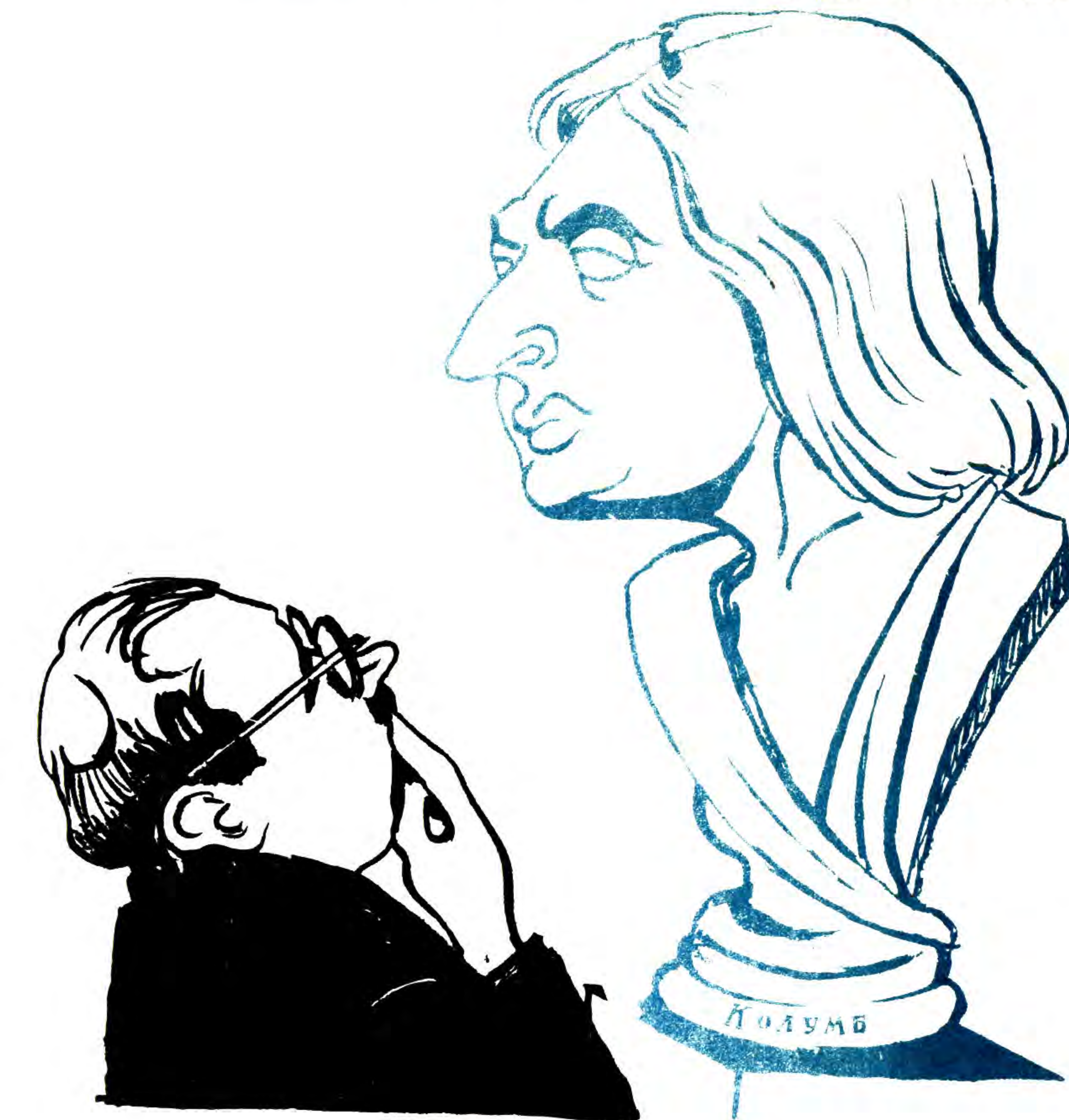
— Подумаєш — Америку відкрив! Спробував би у нашому місті американку відкрити!