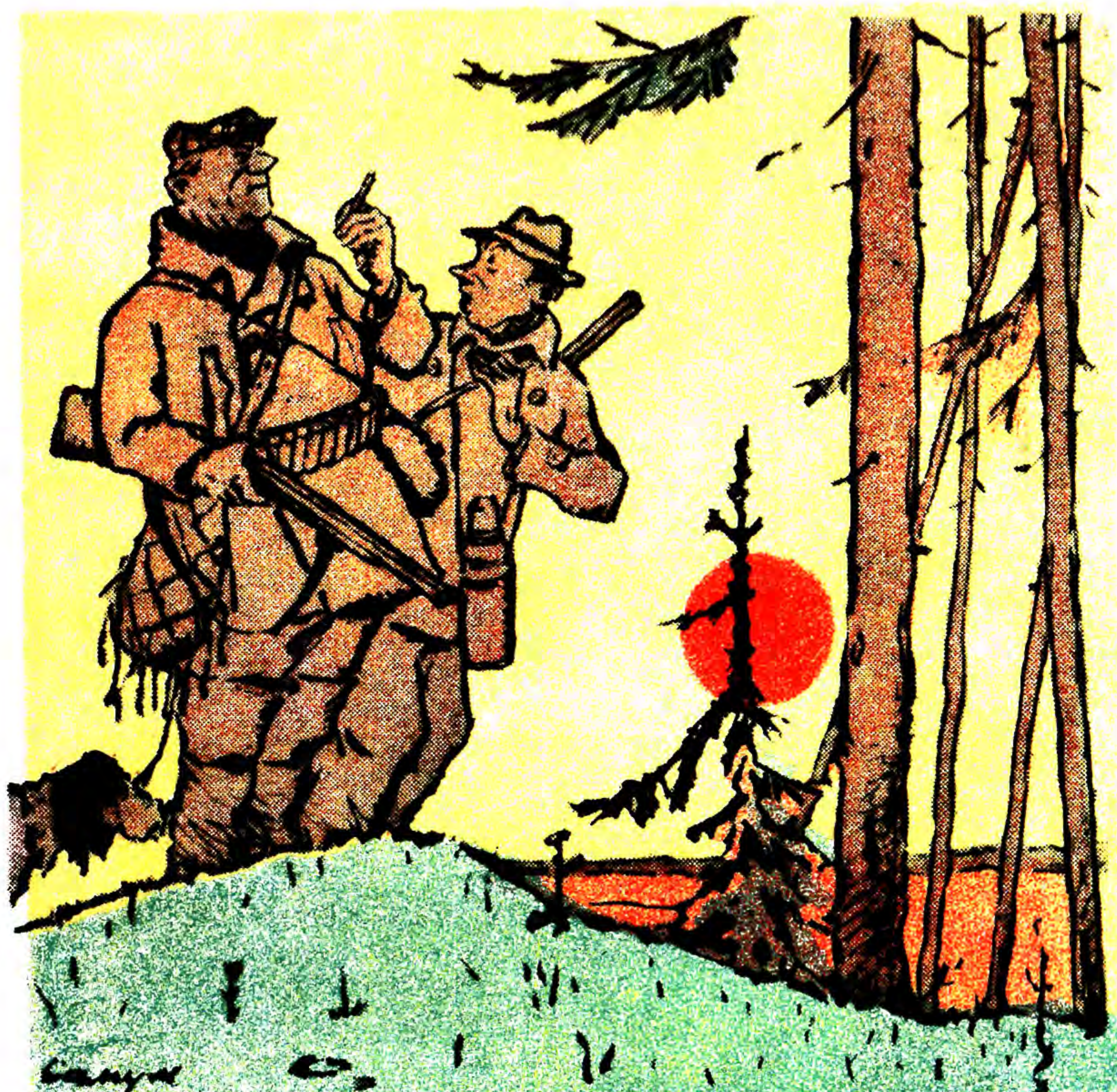
— Вальдшнеп! Стріляйте швидше! — Зачекає, не велика птиця!