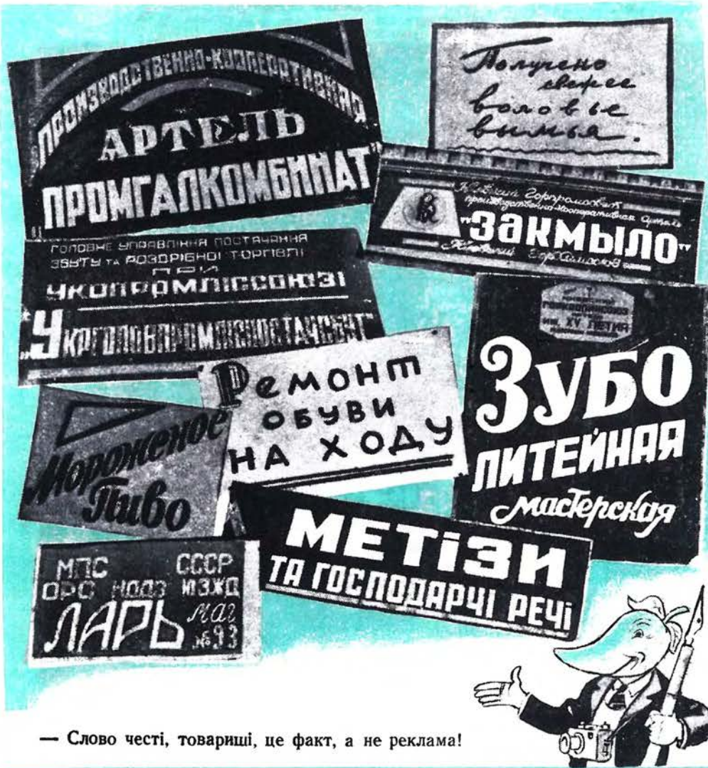
— Слово честі, товариші, це факт, а не реклама!