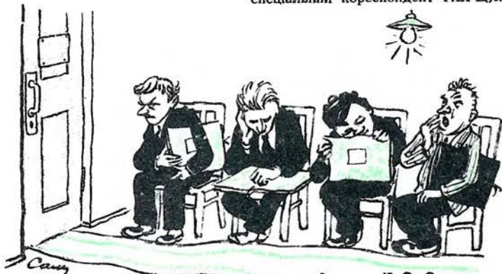
Ілюстрації С. Самуца

П. АФОНСЬКИЙ. спеціальний кореспондент ПЕРЦЯ.