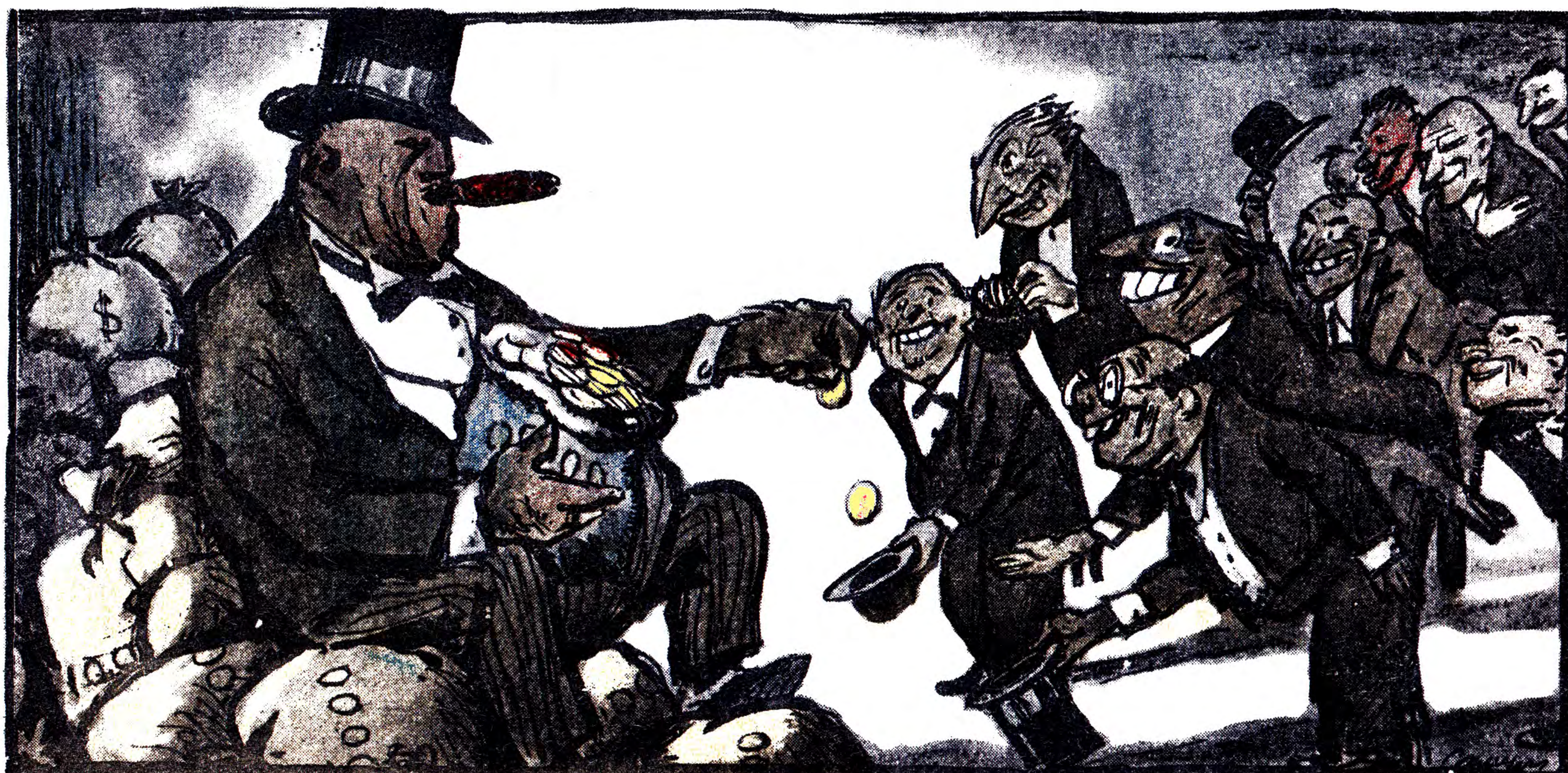
ЇХНІ ДЕПУТАТИ — ТЕЖ ОБРАНЦІ МІЛЬЙОНІВ.