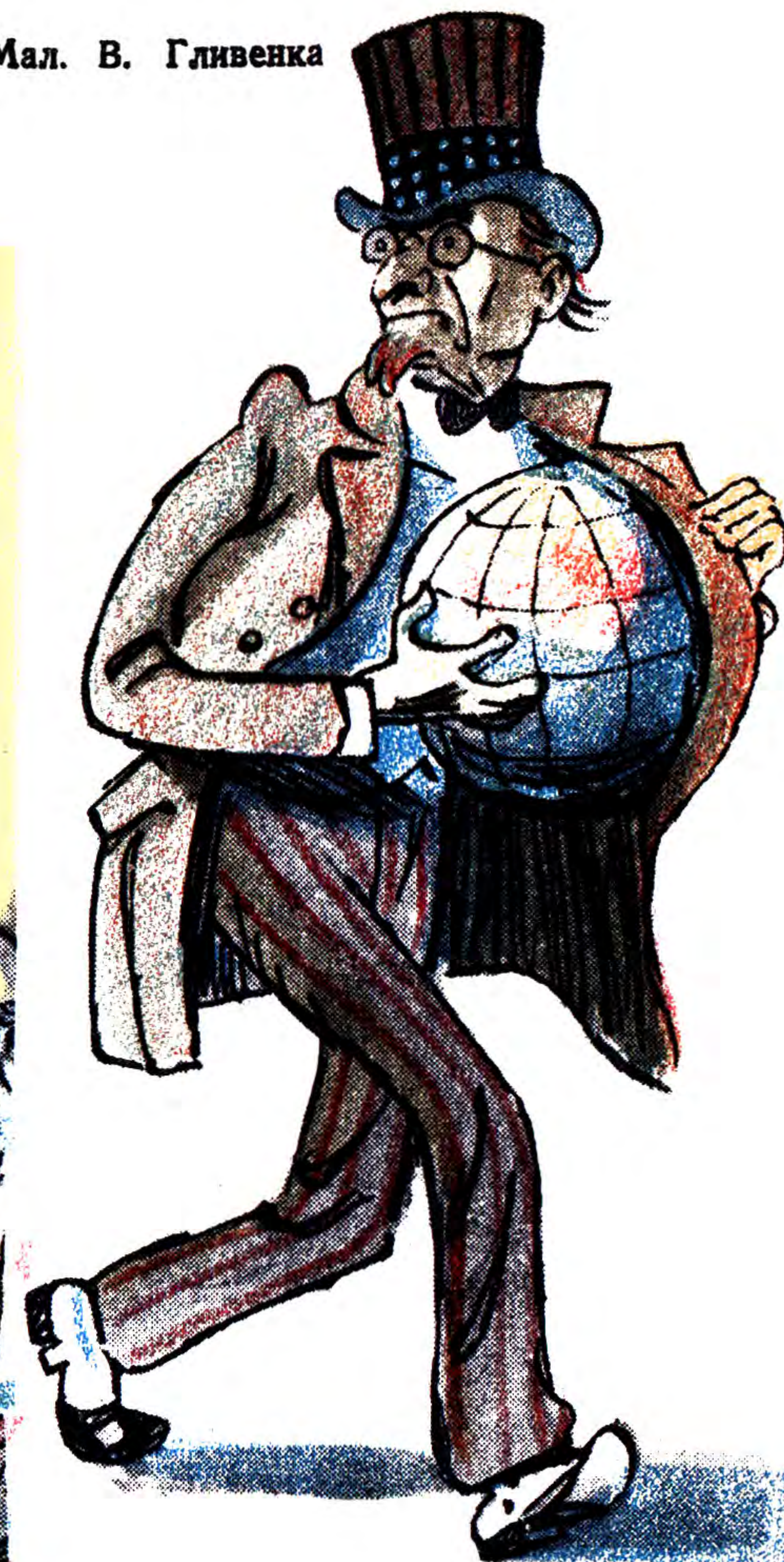
Клептоманія В палаті — сам дядя Сам.