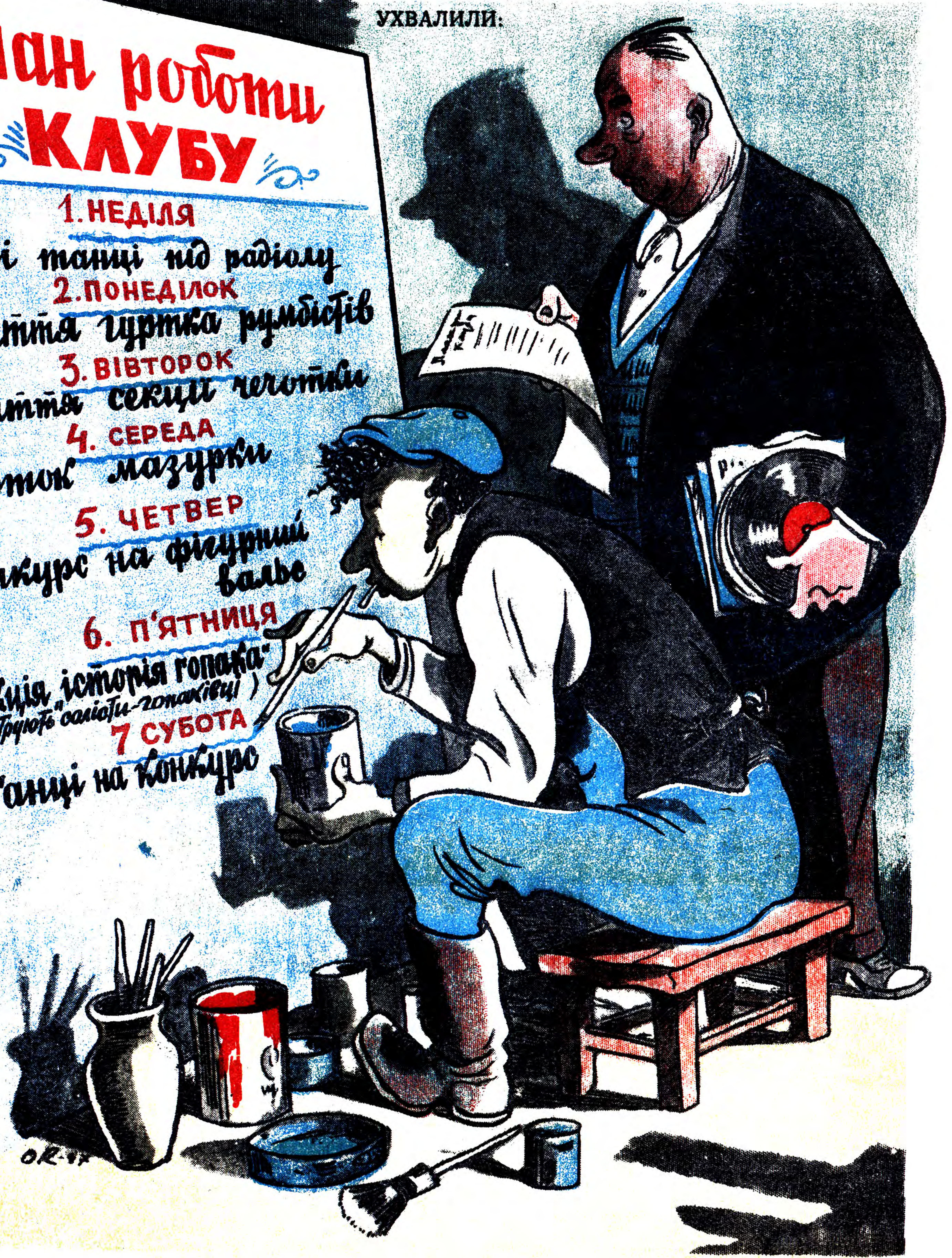
... роботу поставити на ноги.