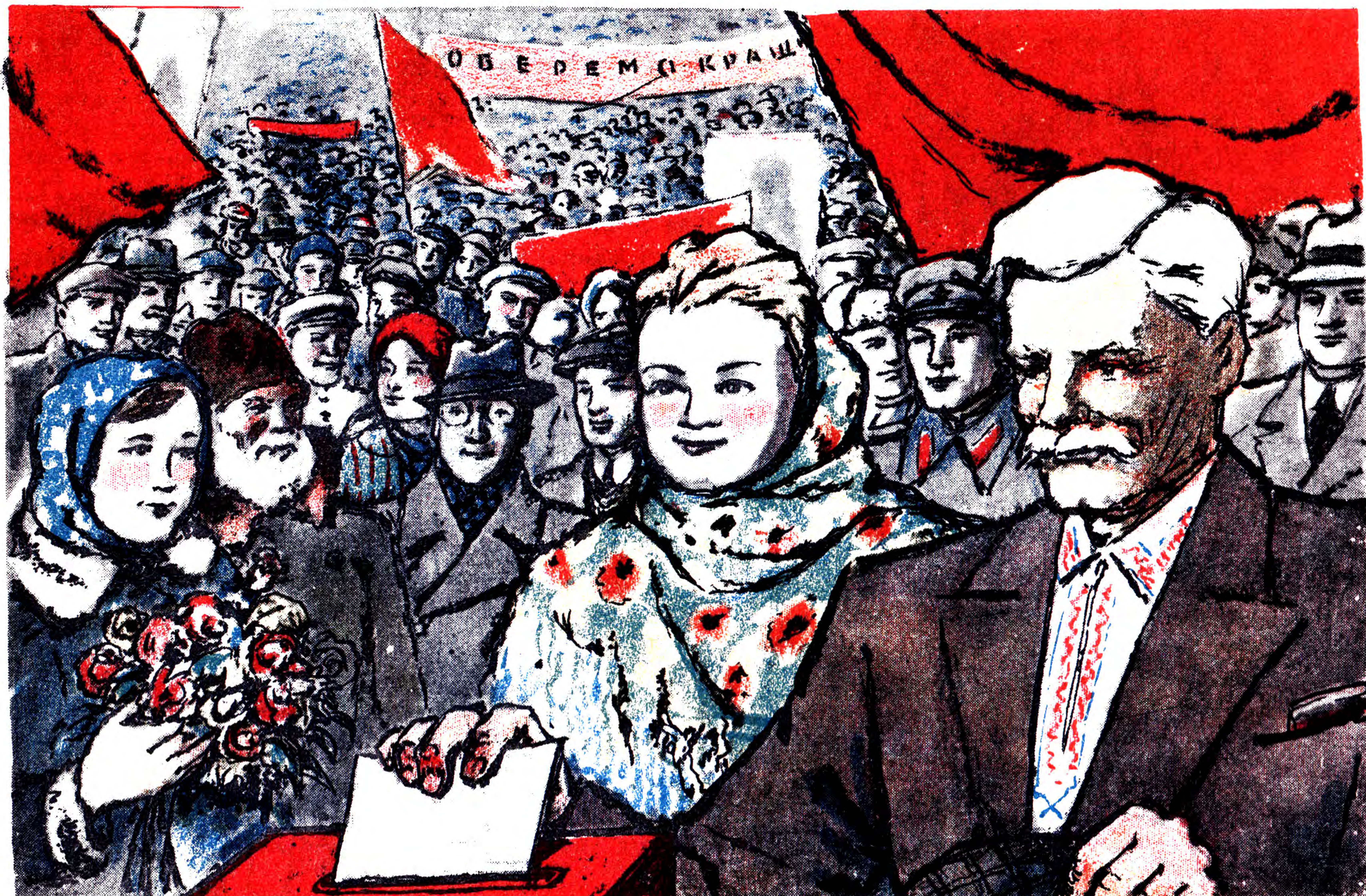
НАШІ ДЕПУТАТИ — ОБРАНЦІ МІЛЬЙОНІВ.