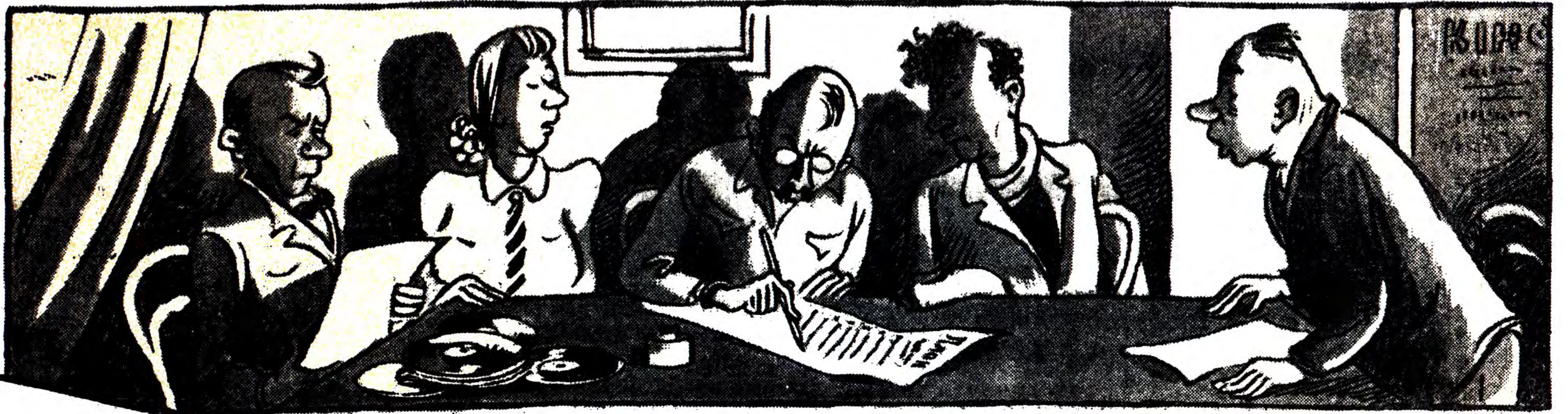
СЛУХАЛИ: Про роботу заводського клубу. УХВАЛИЛИ: