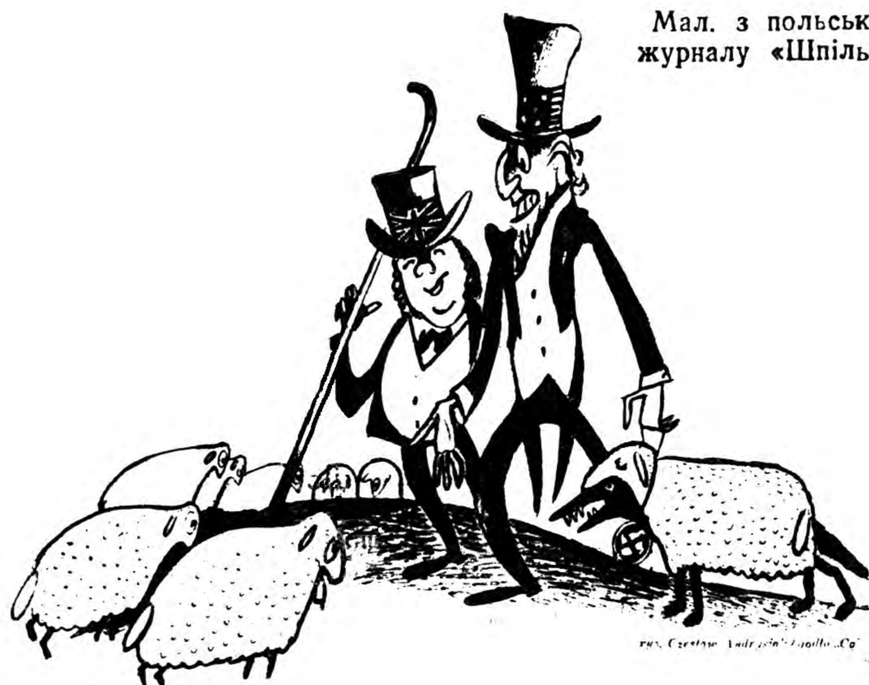
Мал. з польського журналу «Шпількі»