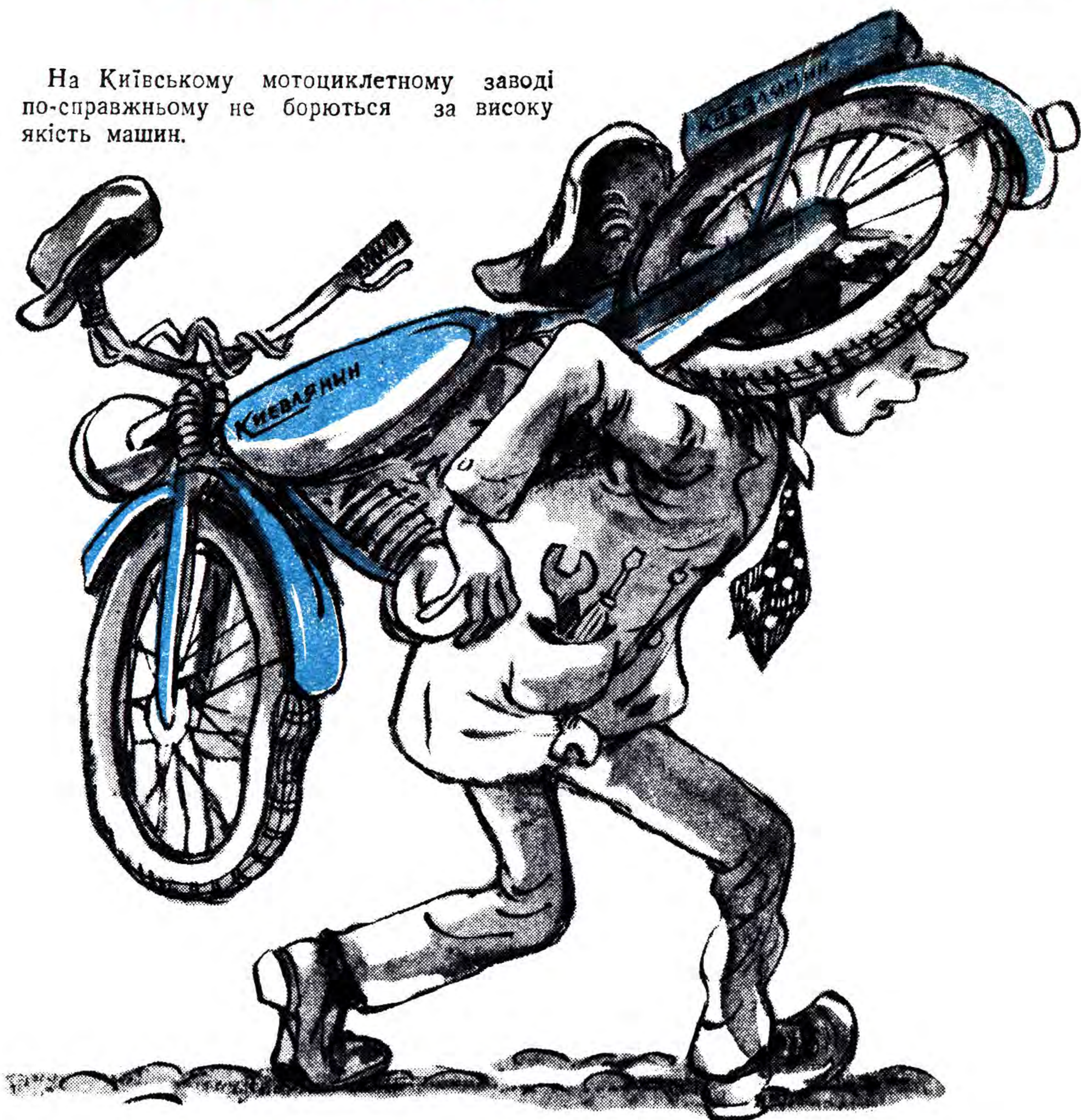
«Київлянин» на київлянині.

На Київському мотоциклетному заводі по-справжньому не борються за високу якість машин.