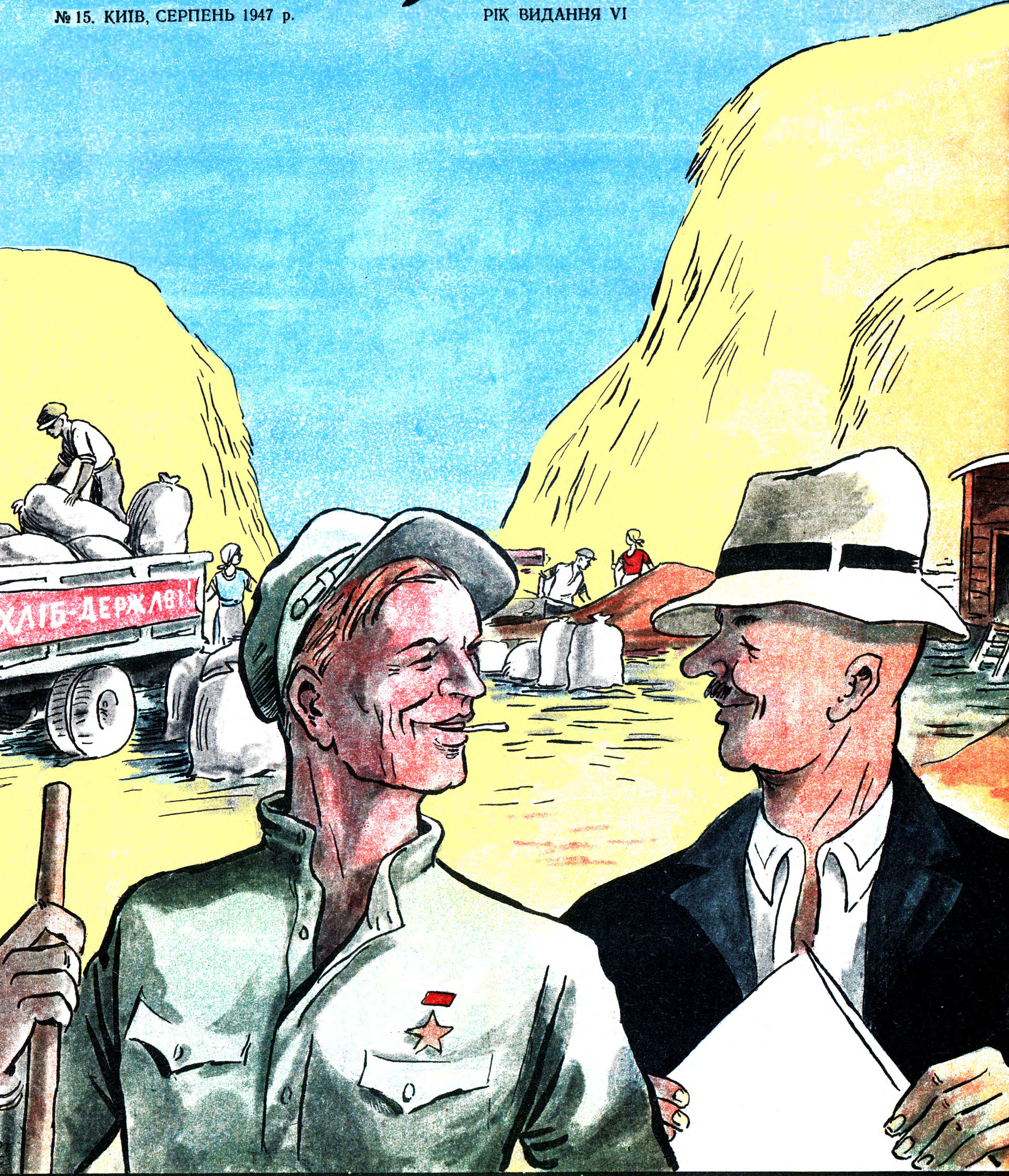
— Молодці твої бригадири — по 200 пудів пшениці з гектара зібрали! — Вони в нас скромні — не з неба зірки знімають.