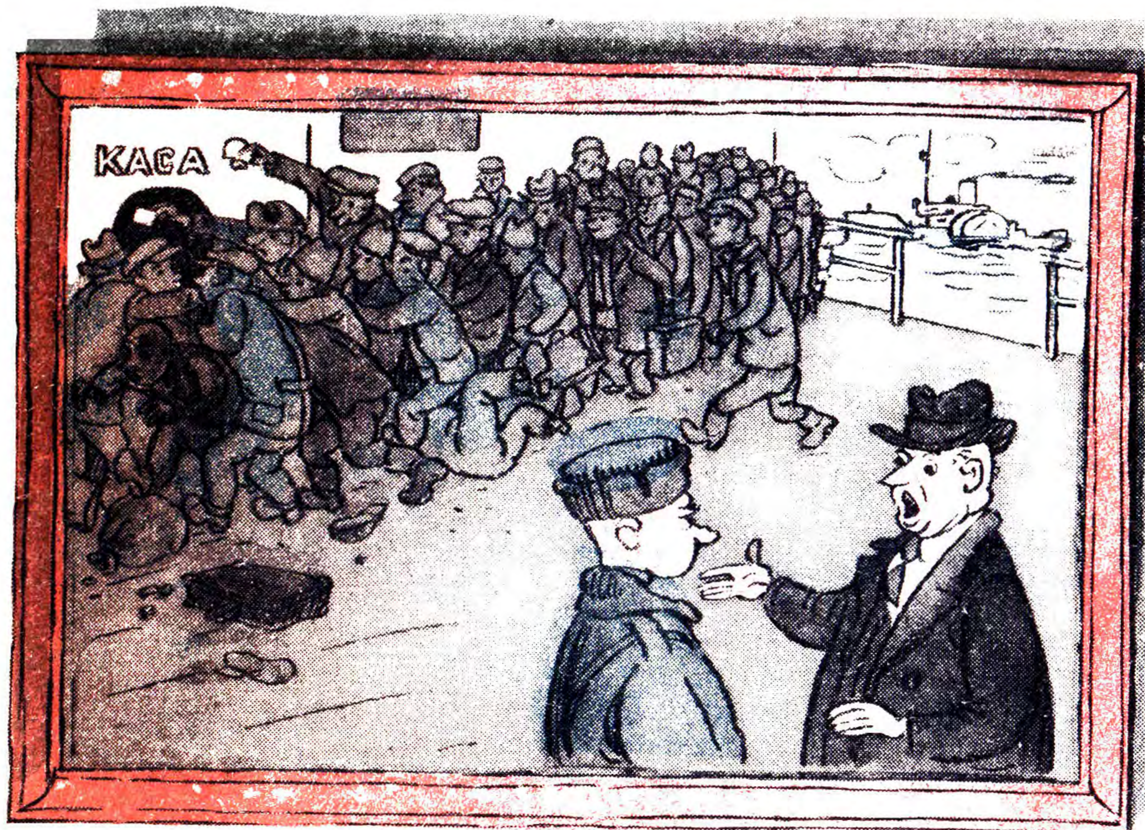
Батальна картина. (На Київському річковому вокзалі).