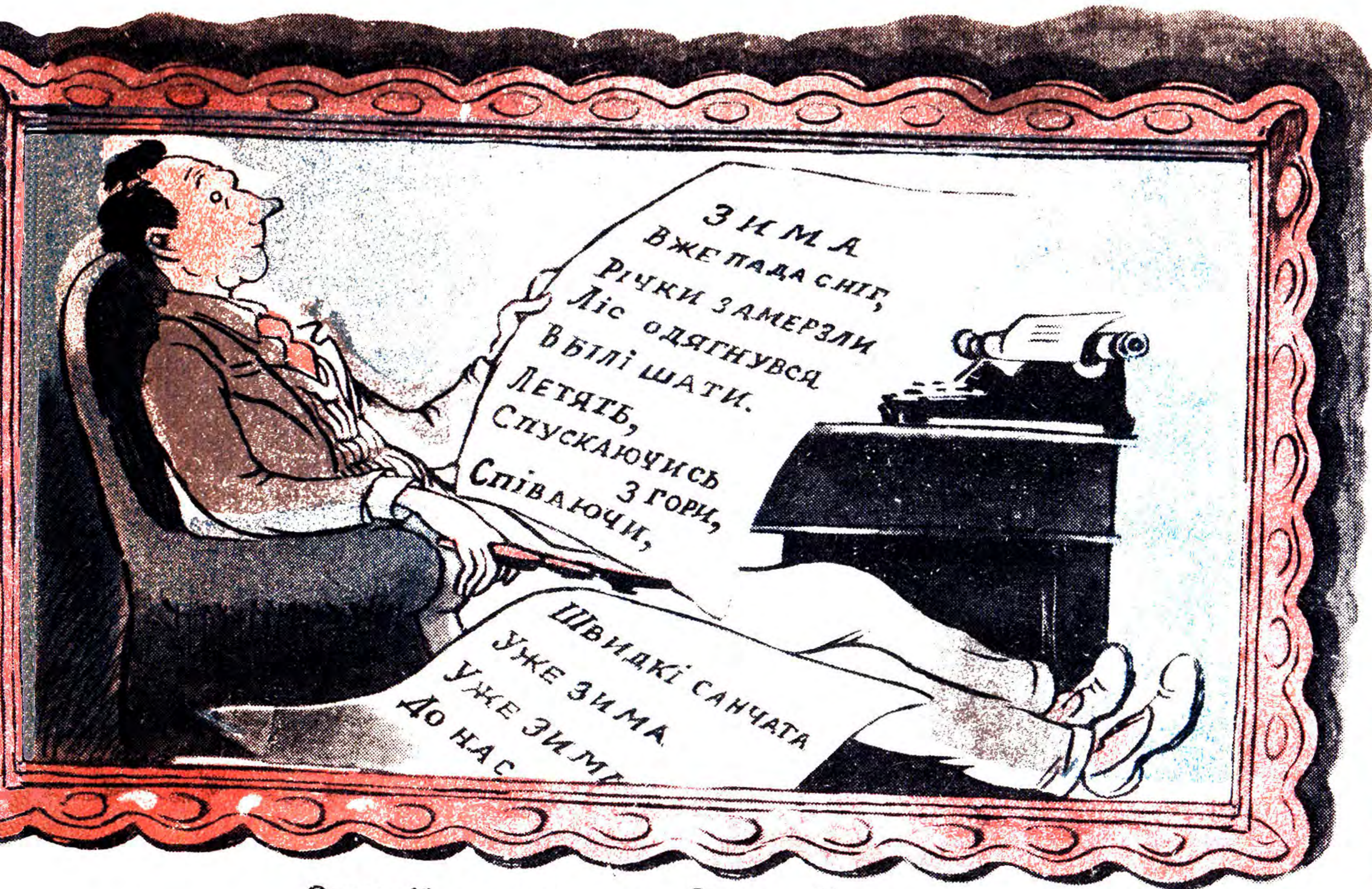
Останній портрет поета Семена Невизнаного.