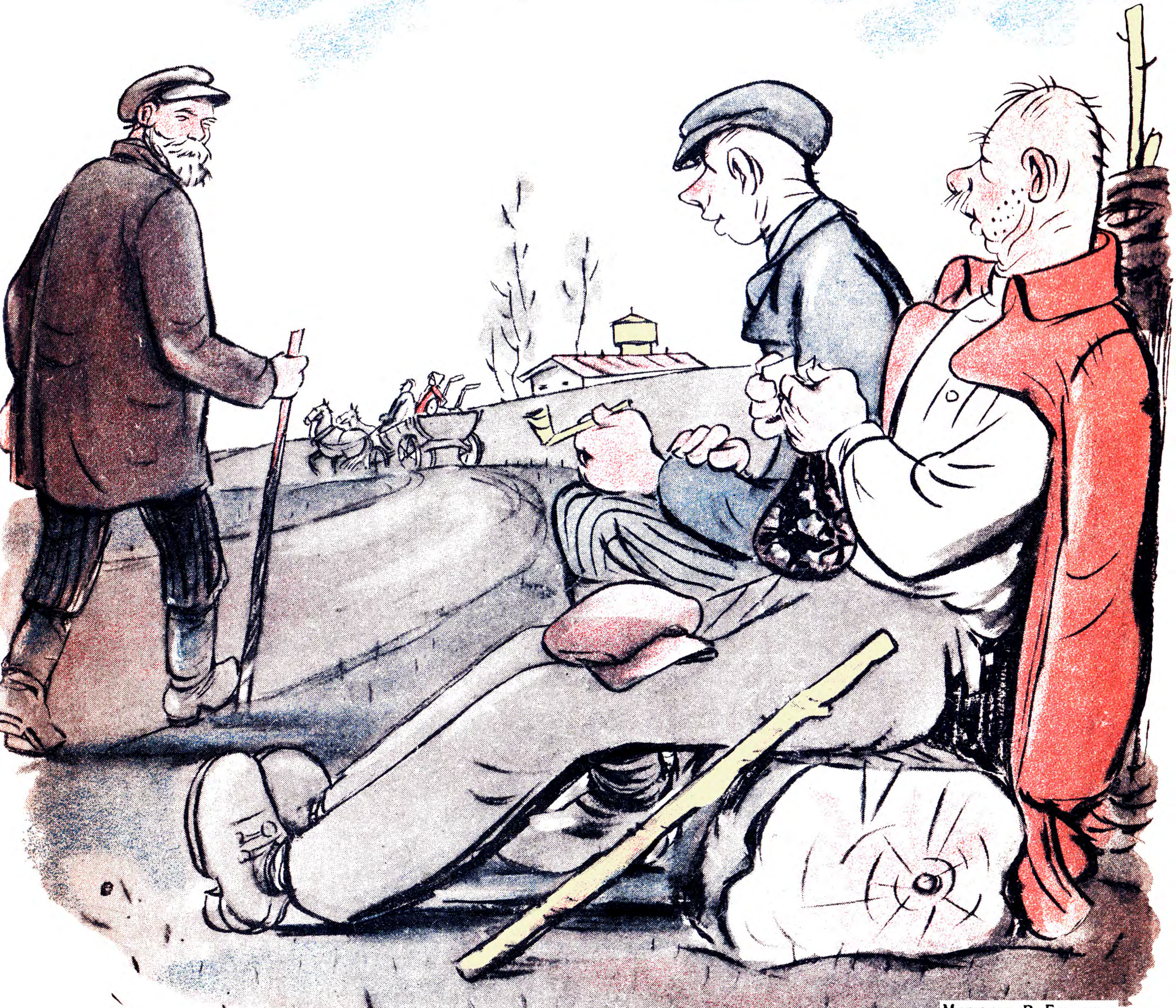
Малюнок В. Гливенка

№ 7. КИЇВ, КВІТЕНЬ 1947 р. РІК ВИДАННЯ VI