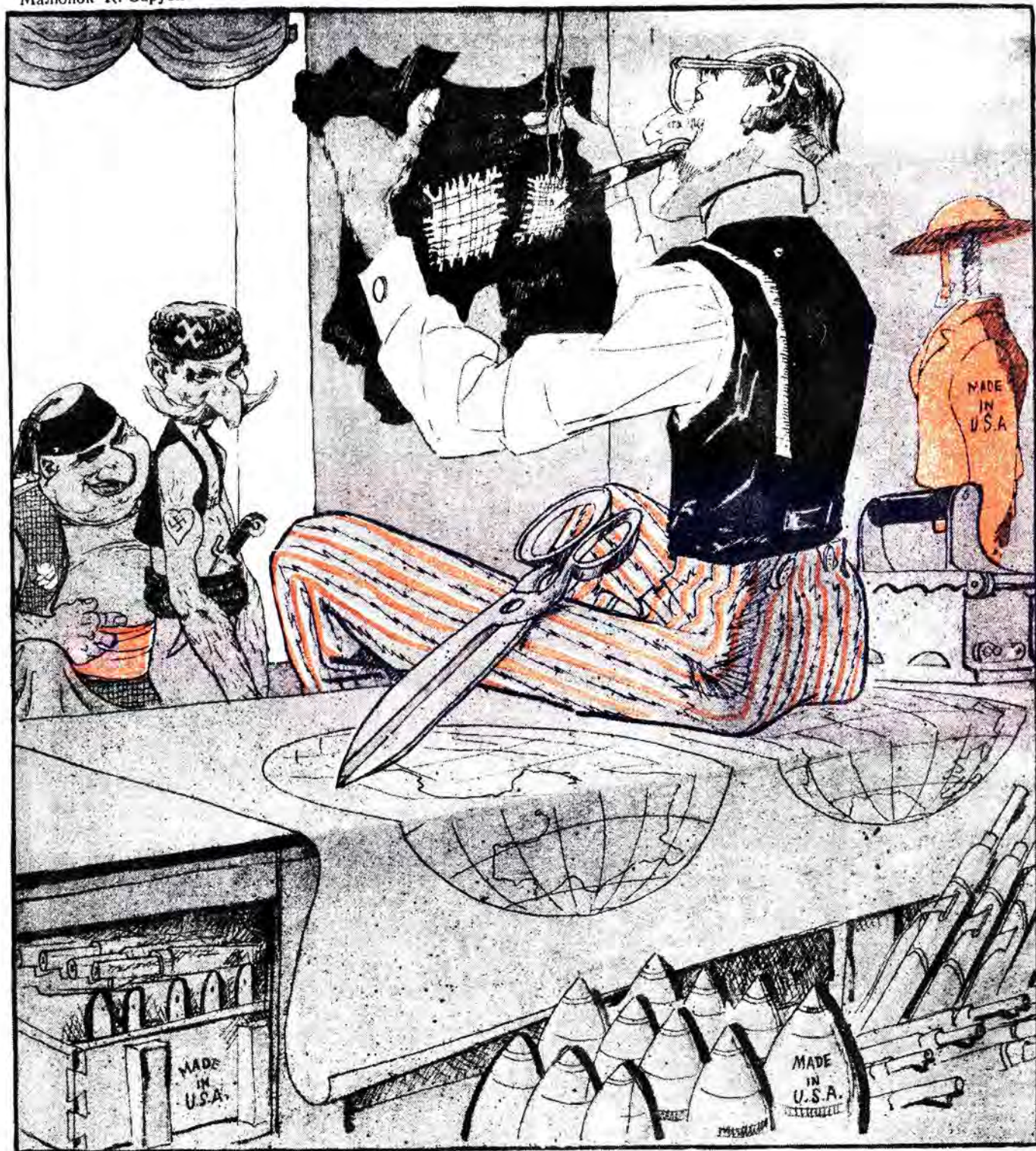
Фарбування у наймодніші демократичні кольори. Моментальне перелицювання. Постійним замовцям — довготерміновий кредит.