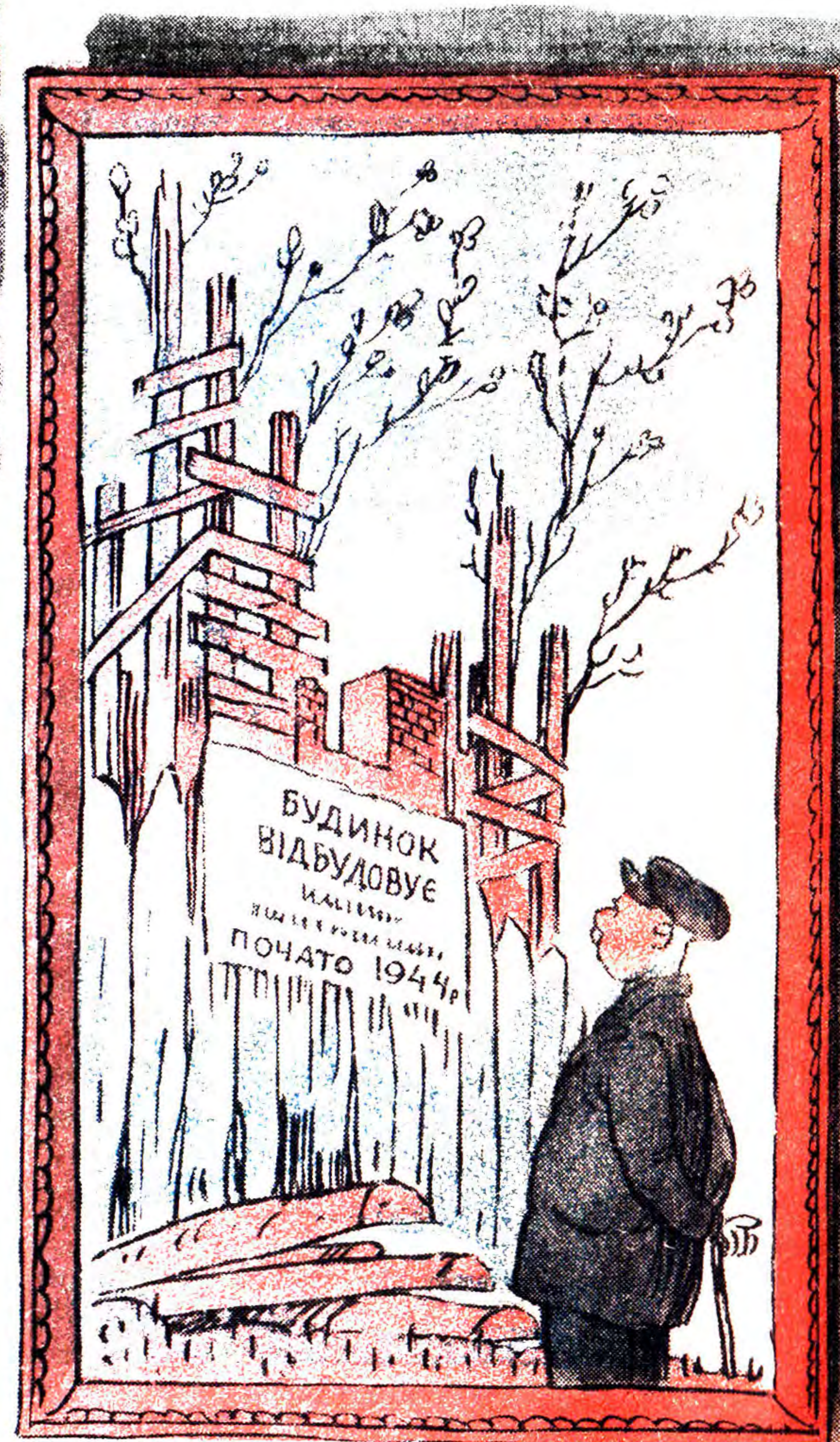
Натюрморт. (Картина художників ОСМЧ-305).