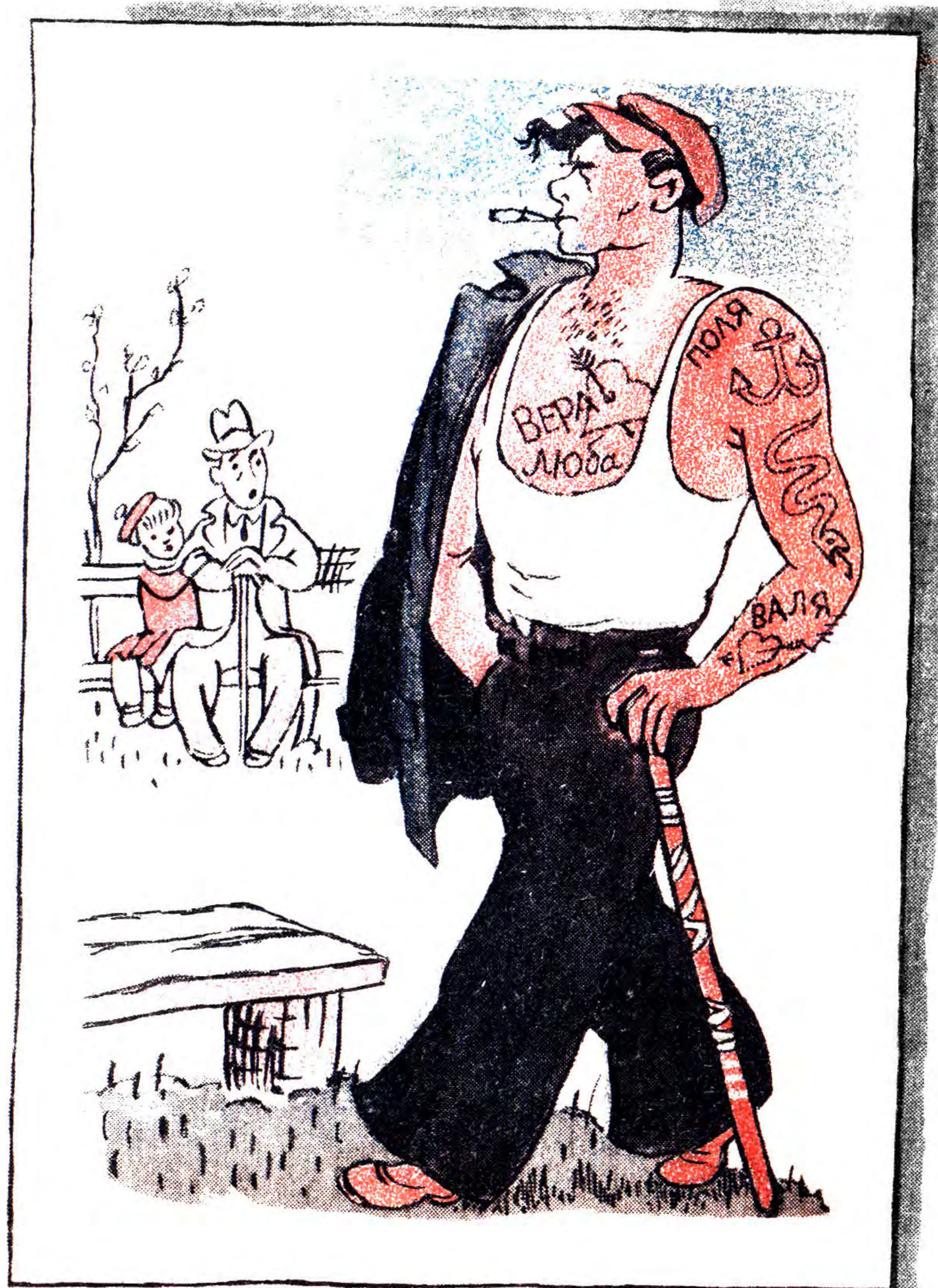
Різьба на дубі.