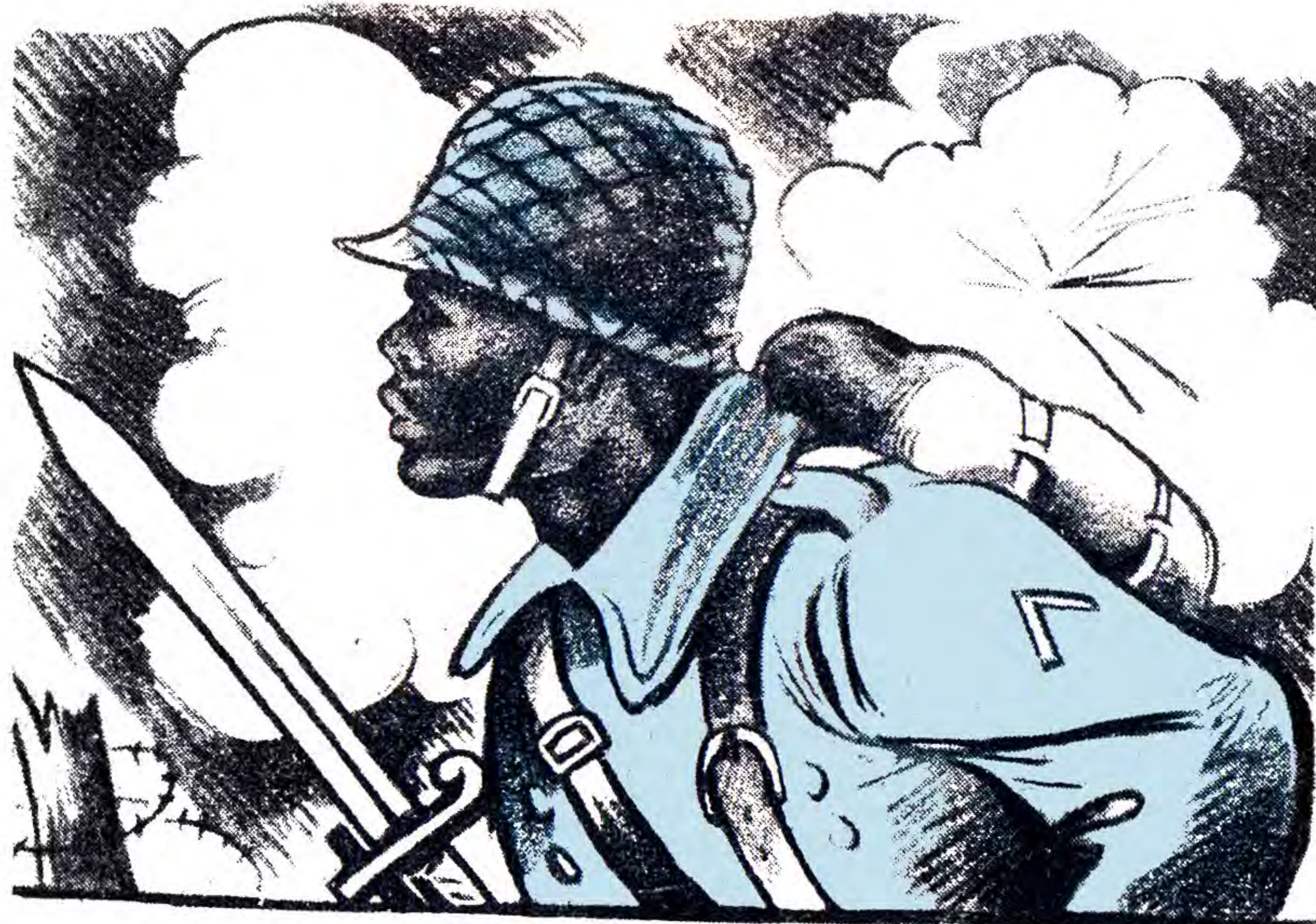
Негр Том захищав Америку від фашистського варварства.

Повертались ми з фронту через буковинські села у свій край над Дніпром.