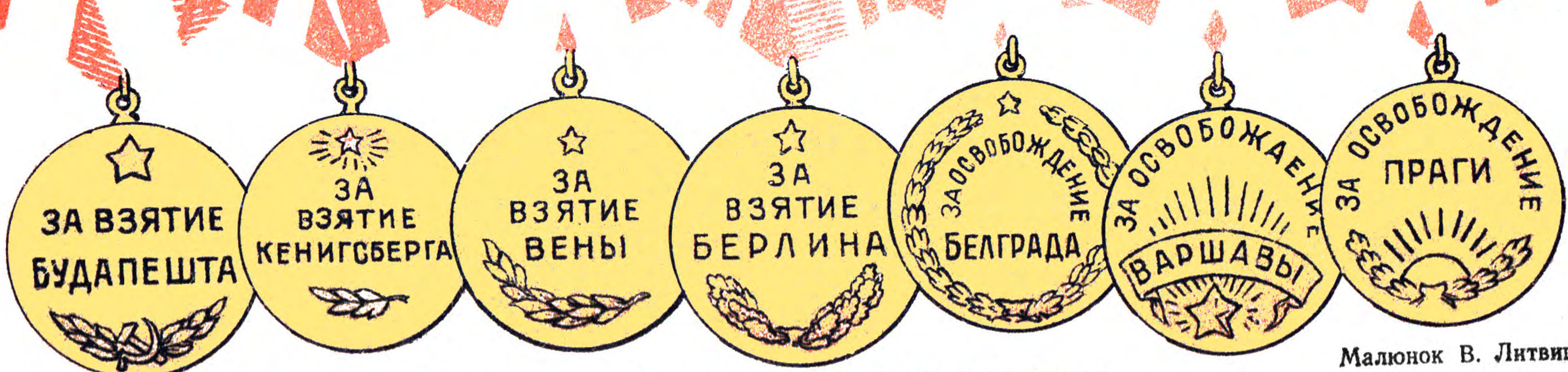
БЛИСКУЧІ ДЕТАЛІ З БІОГРАФІЇ ЮВІЛЯРА