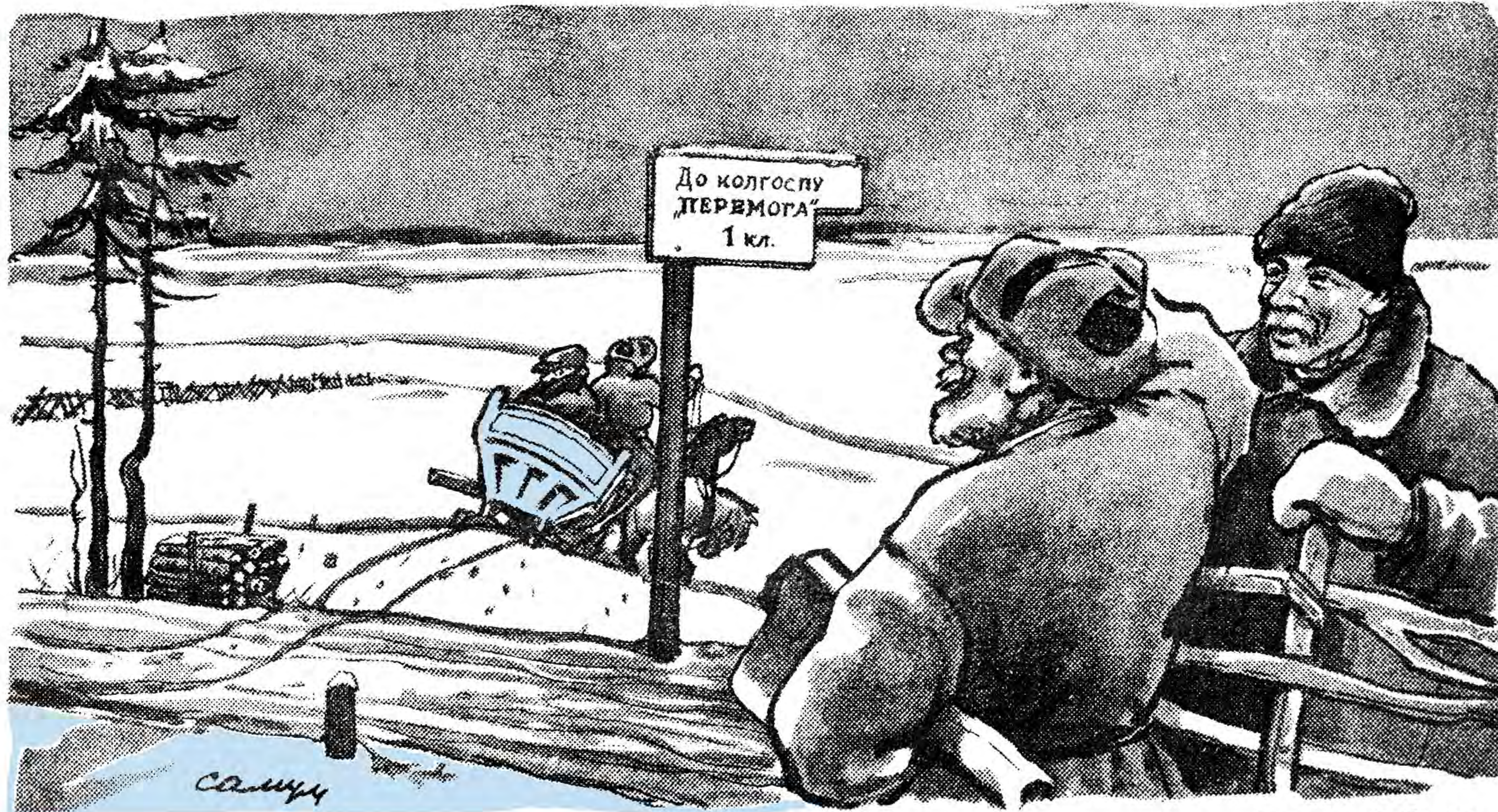
Малюнок С. Самуца