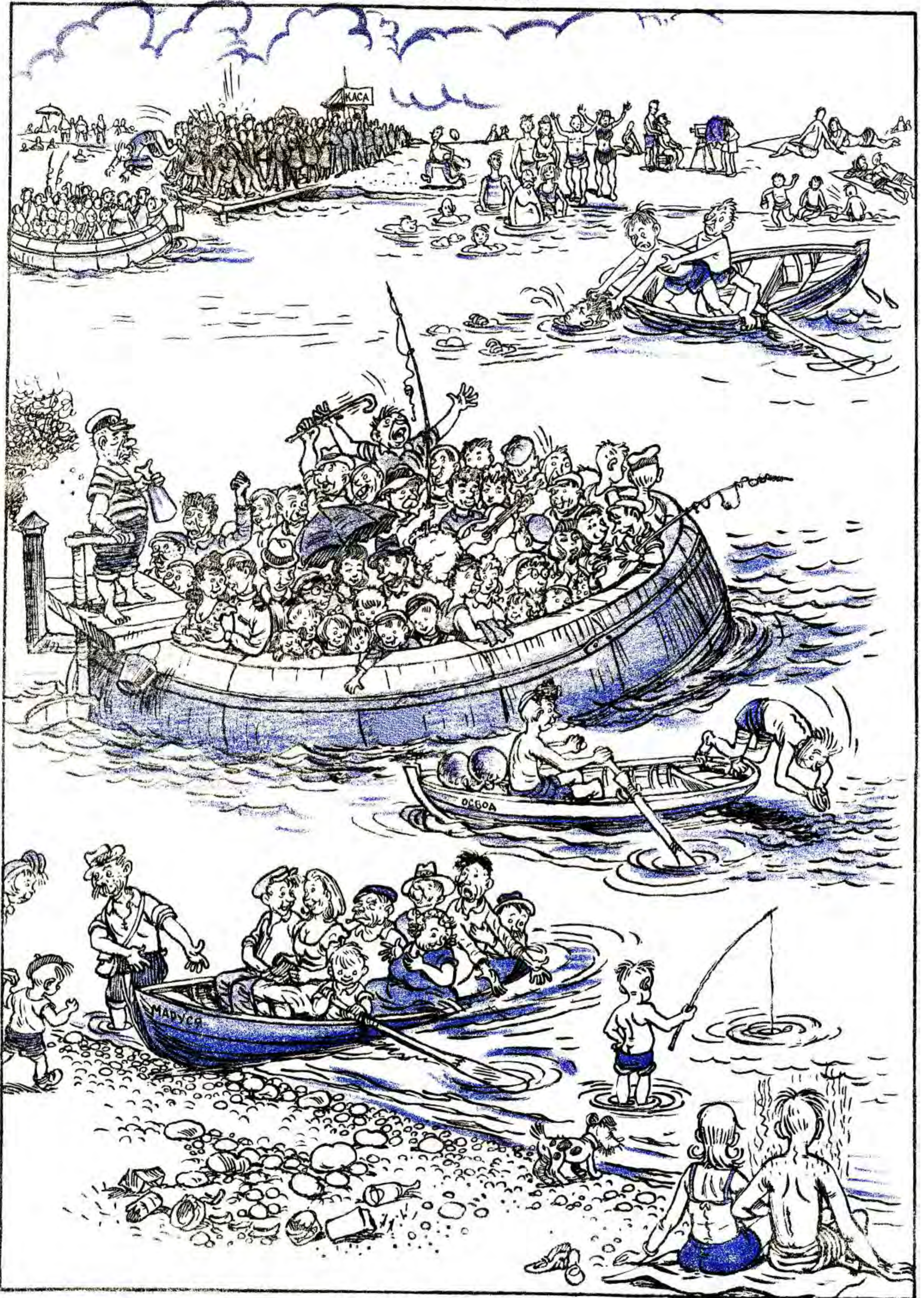
Рече та стогне Дніпр широкий...