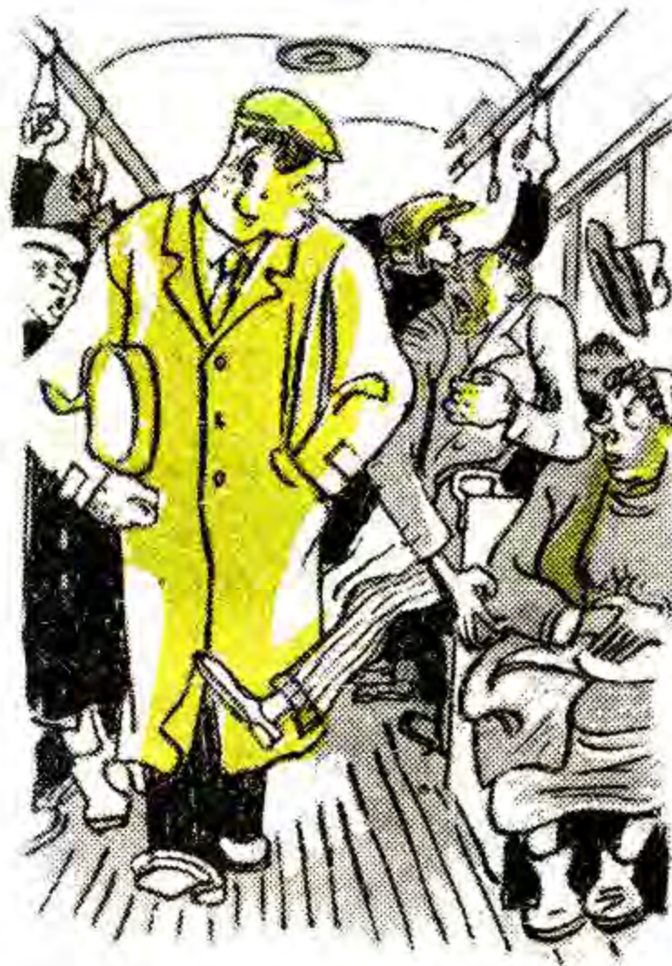
— Ой не штовхайтесь! — Вибачте, я думав, що ви жінчина.

цього справді волячого досягнення Кишеньківського райвідділу зв'язку.