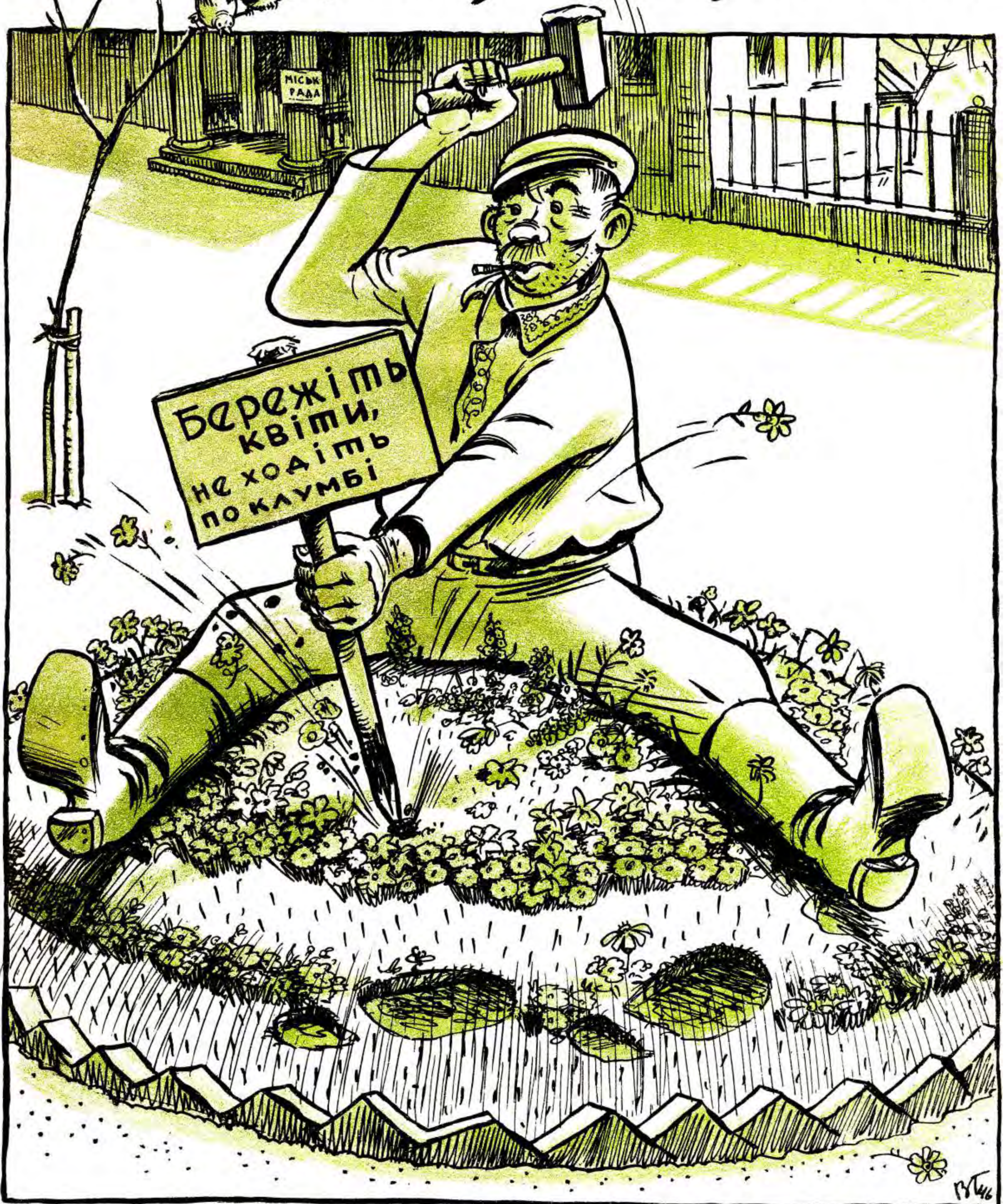
НА СТОРОЖІ ПОРЯДКУ