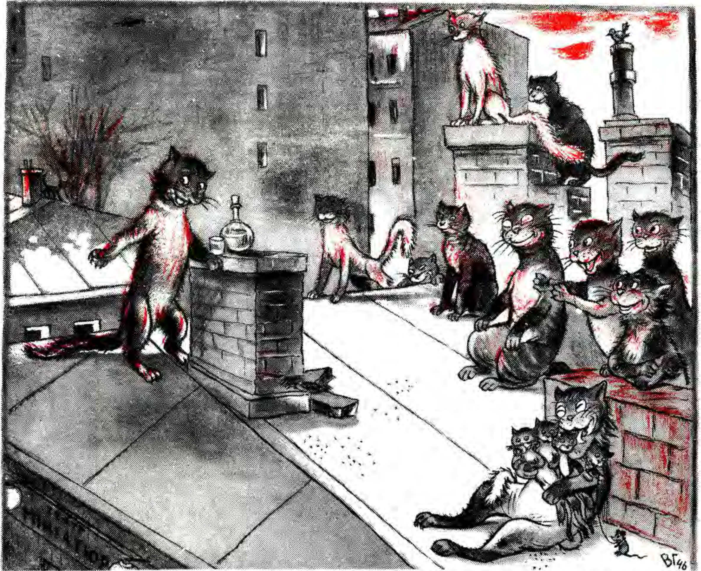
— Що ми можемо відмітити на сьогоднішній день? На сьогоднішній день робота нашого колективу є значним доповненням до роботи театру мініатюр.