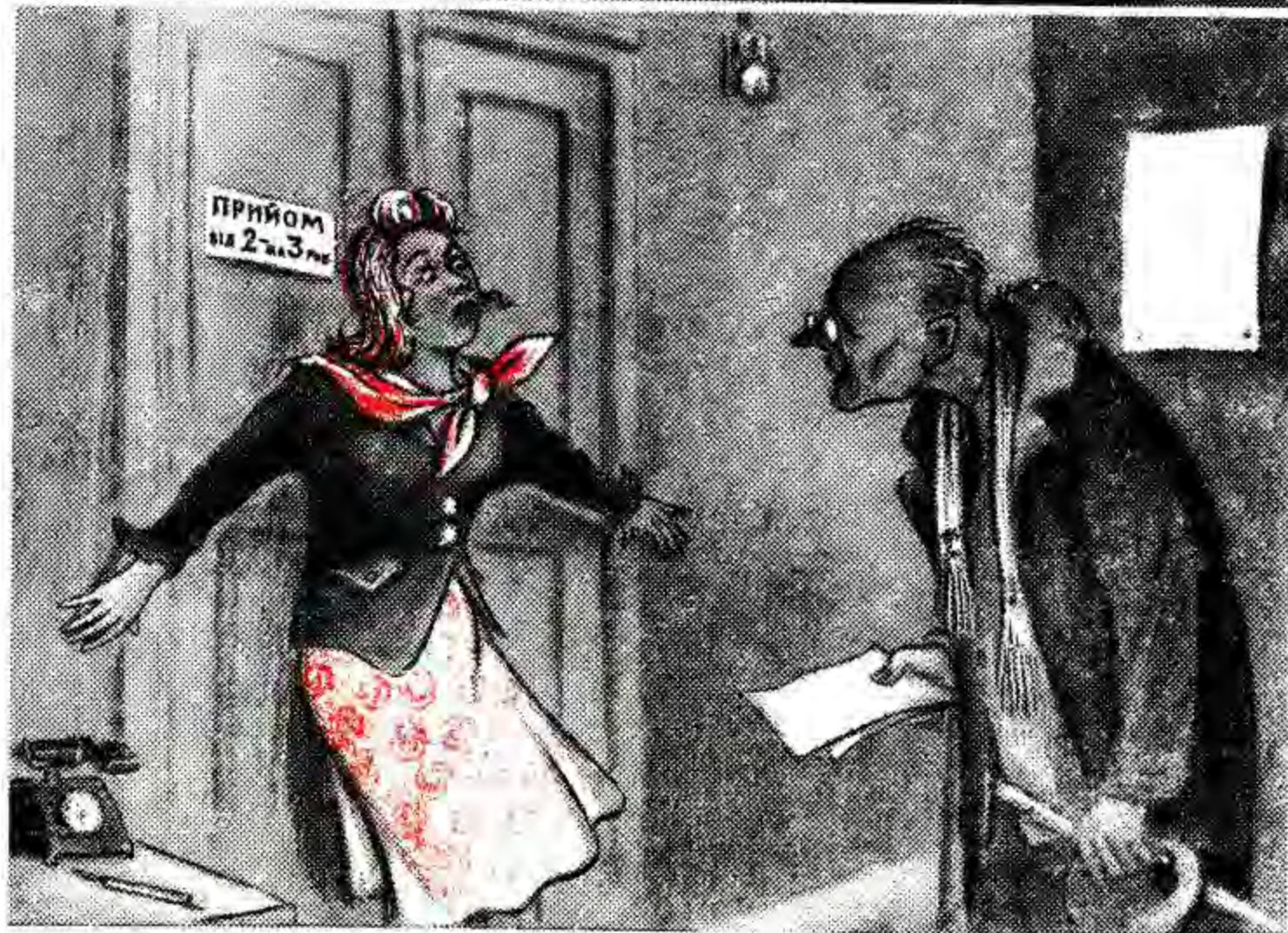
Картина художника Маковського «Не пущу» та її новий варіант (Худ. Козюренко).