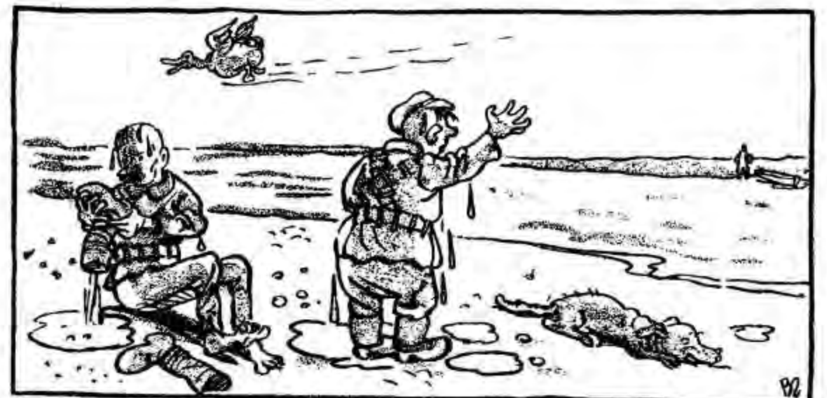
Лежать рушниці десь на дні, Мисливці мокрі і нудні,