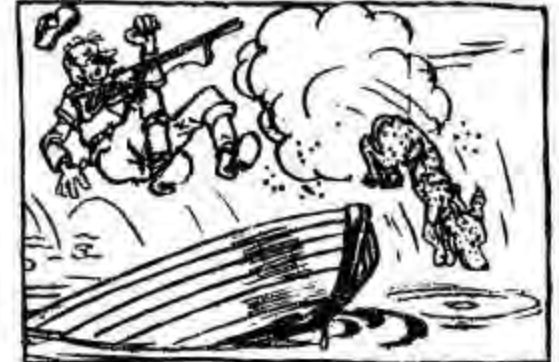
Подумайте, яка невдача (Буває і в рушниці «віддача».) Мисливець сам у воду: бух, У качки ж цілий навіть пух.