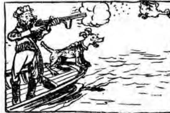
Ба, «на ловця і звір біжить» — Один мисливець став у мить, З обох стволів по качці «бах!» Та неуразним лише птах.