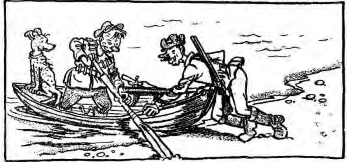
Завзяті хлопці—мисливці (Іх звуть в народі «брехунці»)