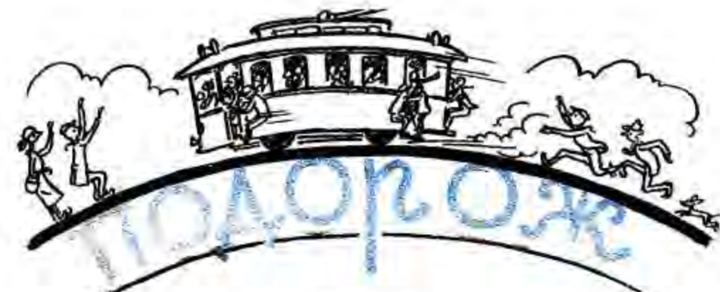
Малюнки О. Сашка.

Я не збираюся писати Про подорож в далекий край, А хочу трохи звіршувати Лише про київський трамвай..