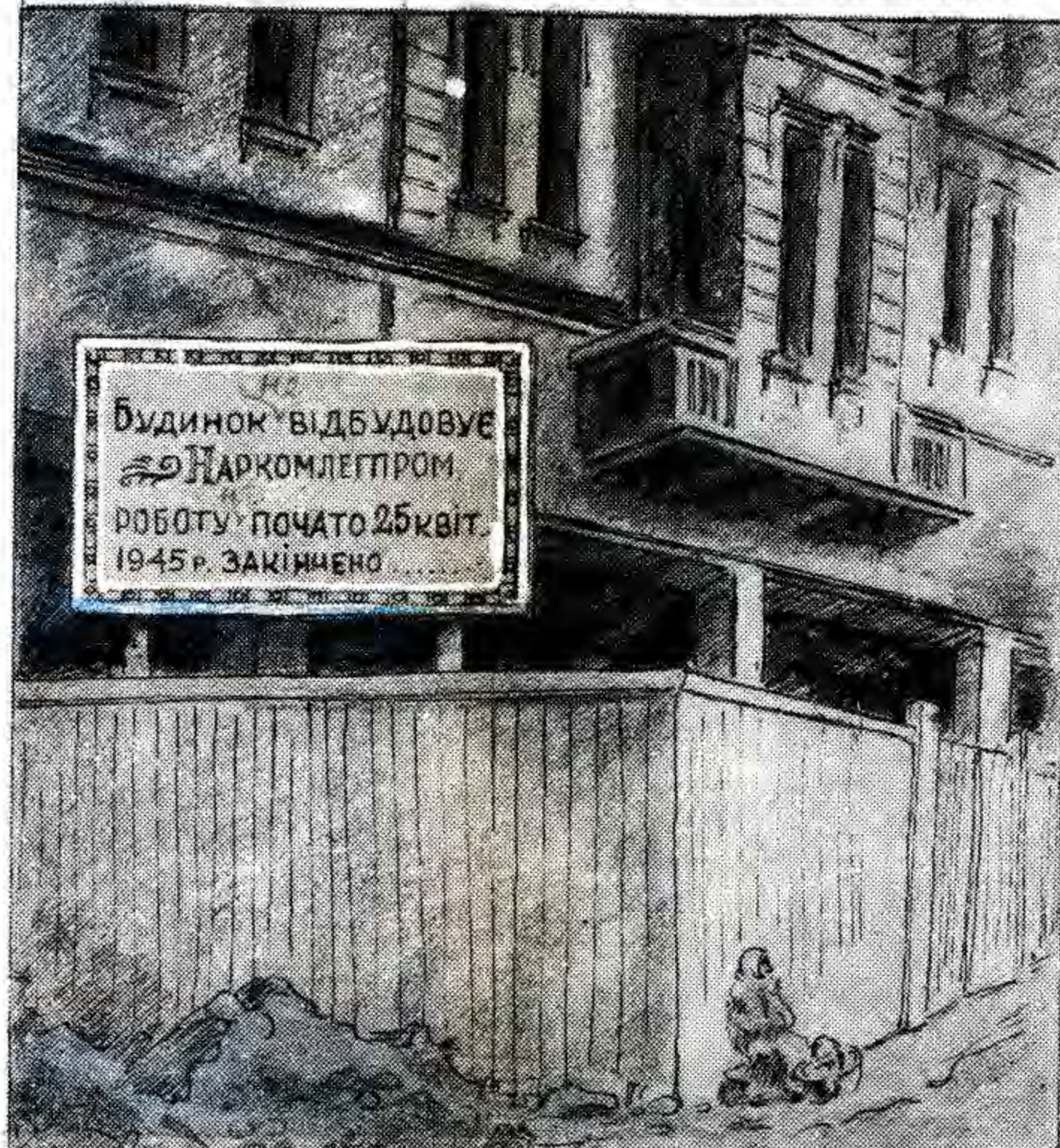
КАРТИНКА БЕЗ СЛІВ.