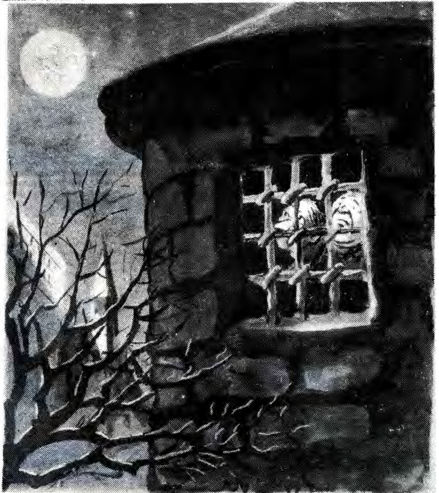
РІББЕНТРОП. — Дивись, і нам місяць світить... ГЕРІНГ. — Нам, брат, світить не місяць і не рік, а два стовби з перекладною.