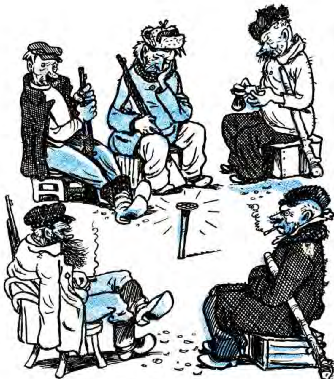
П'ЯТЬ СТОРОЖІВ ТА ОДИН ГВІЗДОК.