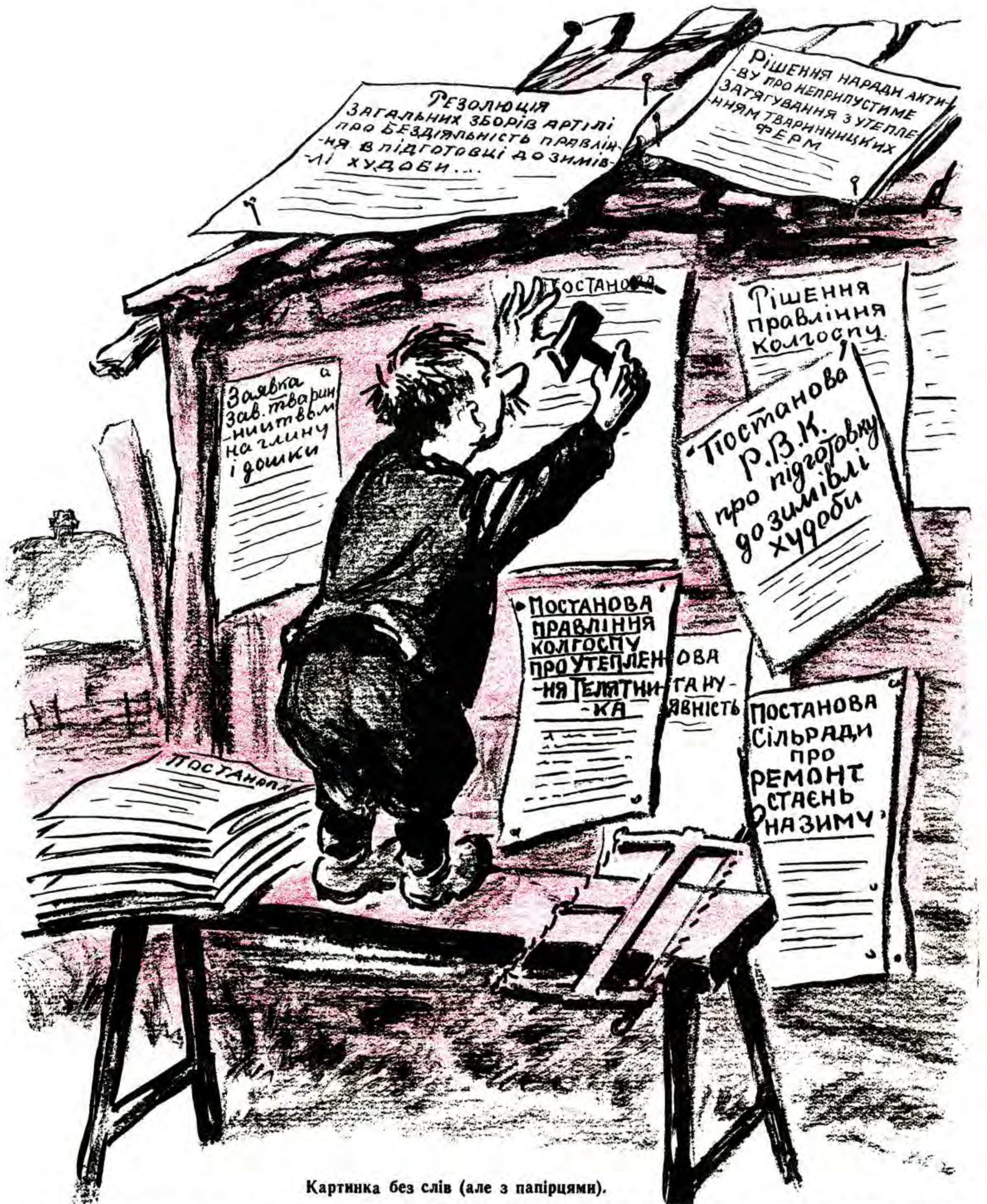
Картинка без слів (але з папірцями).

Будівництво і ремонт тваринницьких приміщень у багатьох колгоспах провадяться дуже повільно.