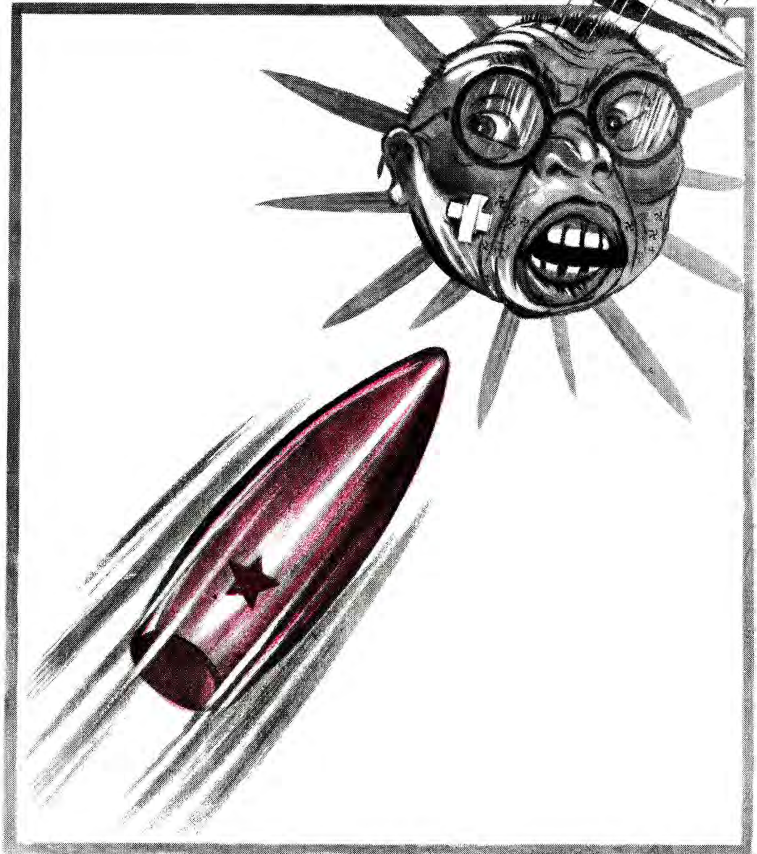
Остаточне затемнення японського сонця.