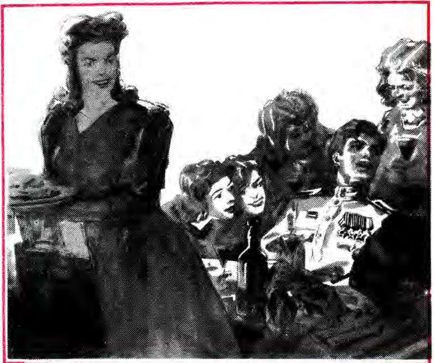
— Глянь, Парасю, як твого солдата дівчата оточили. — Нічого не вдієш, він у мене тепер повний кавалер!

Яка людина Єлизавета Єлізарівна! Василя вона просвітила, ніби рентгеном. Боже мій, як низько впав цей, з дозволу сказати, сусід! Живе, розумієте, мов лорд: дверима грюкає і в коридорі не підмітає. Єлізарівна, звичайно, не змовчала, відбулася бурхлива розмова. Перші два тижні він ходив навщипках і тільки сопів, а потім вибрав хвилину та — бац! — пустив з другого поверху на голову моєї тещі тропічну квітку — олеандр, — сам горщик кілограмів з десять важить. Єлізарівна тільки ахнула, а горщик розбився. Рідкий випадок у медицині — теща лишилася жива.