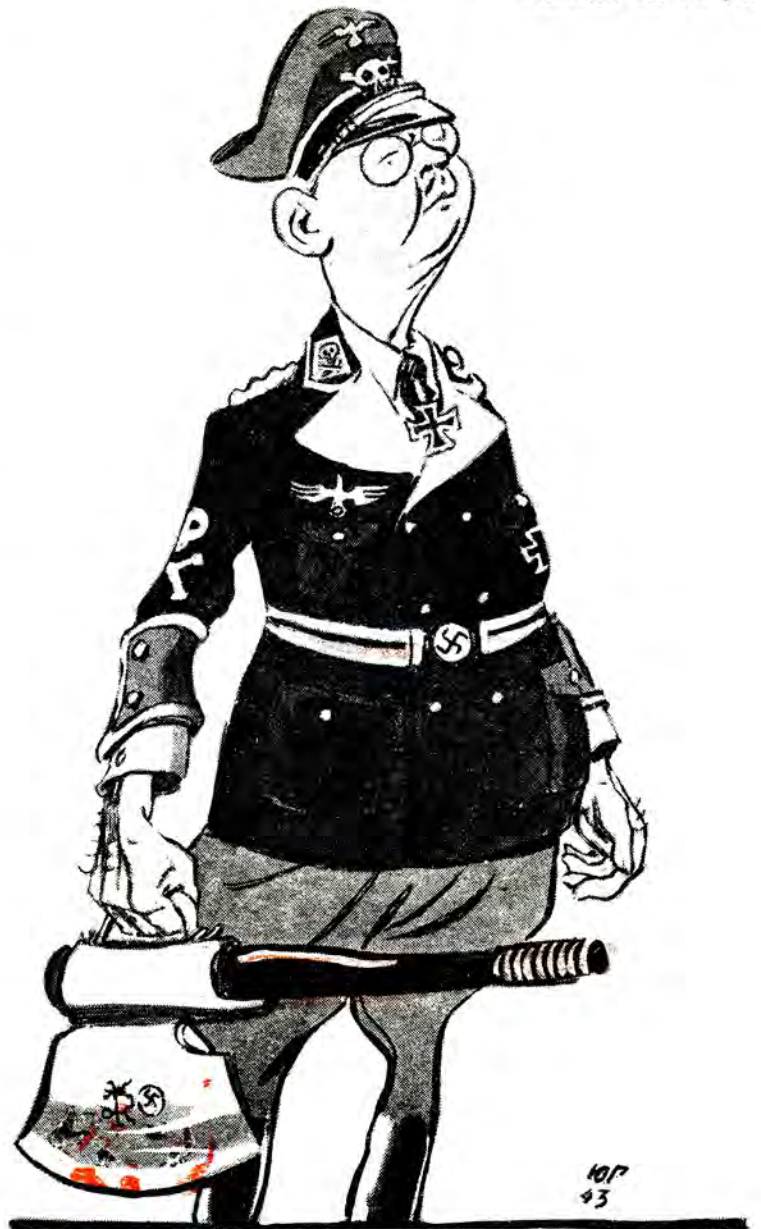
Міністр з портфелем.