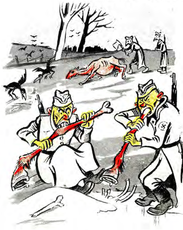
«Коні не винні».