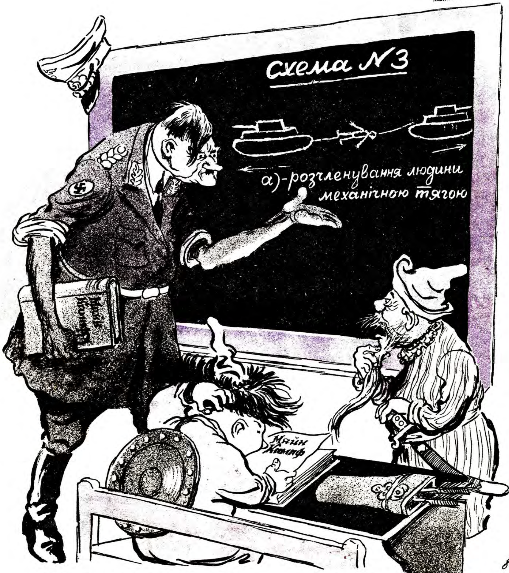
ГІТЛЕР (до Батія й Чингіс-Хана). — Ви знов не вивчили уроку, жовті собаки?! Не розумію, чому це історики так вихваляли вашу жорстокість і кровожадність?!...