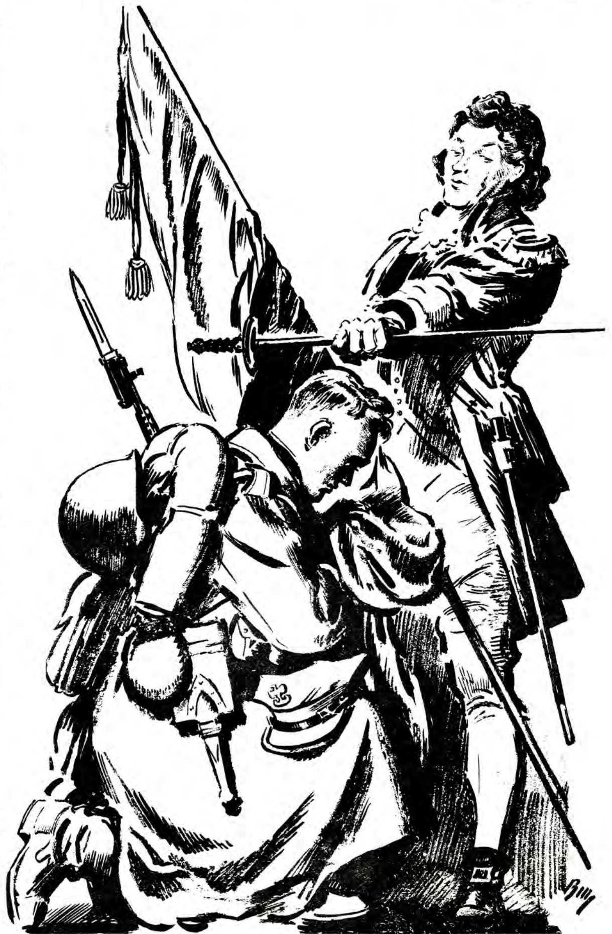
ТАДЕУШ КОСТЮШКО.—Будь вірним солдатом Республіки! Доля батьківщини в твоїх руках.