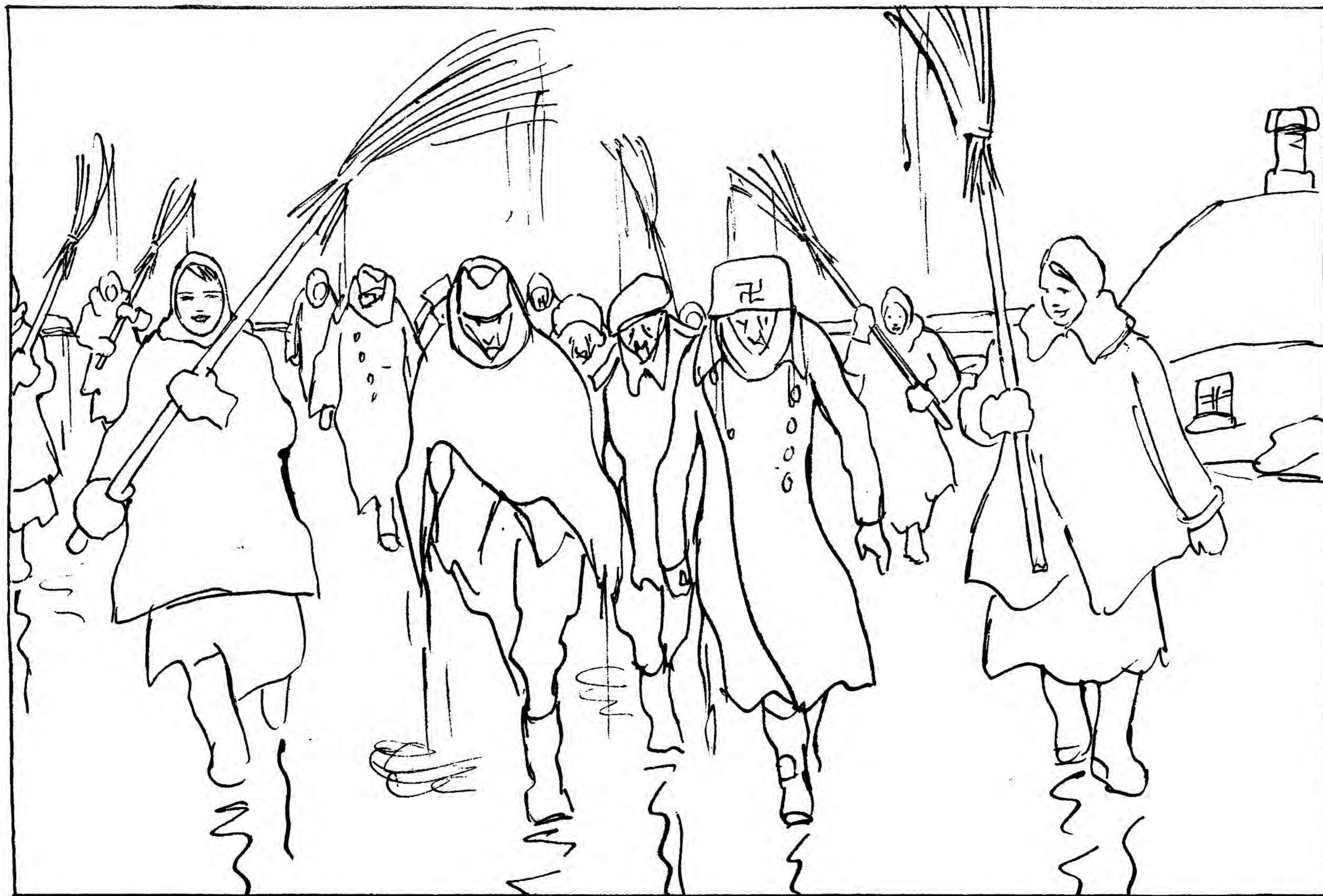
З водохрещі на Дону.