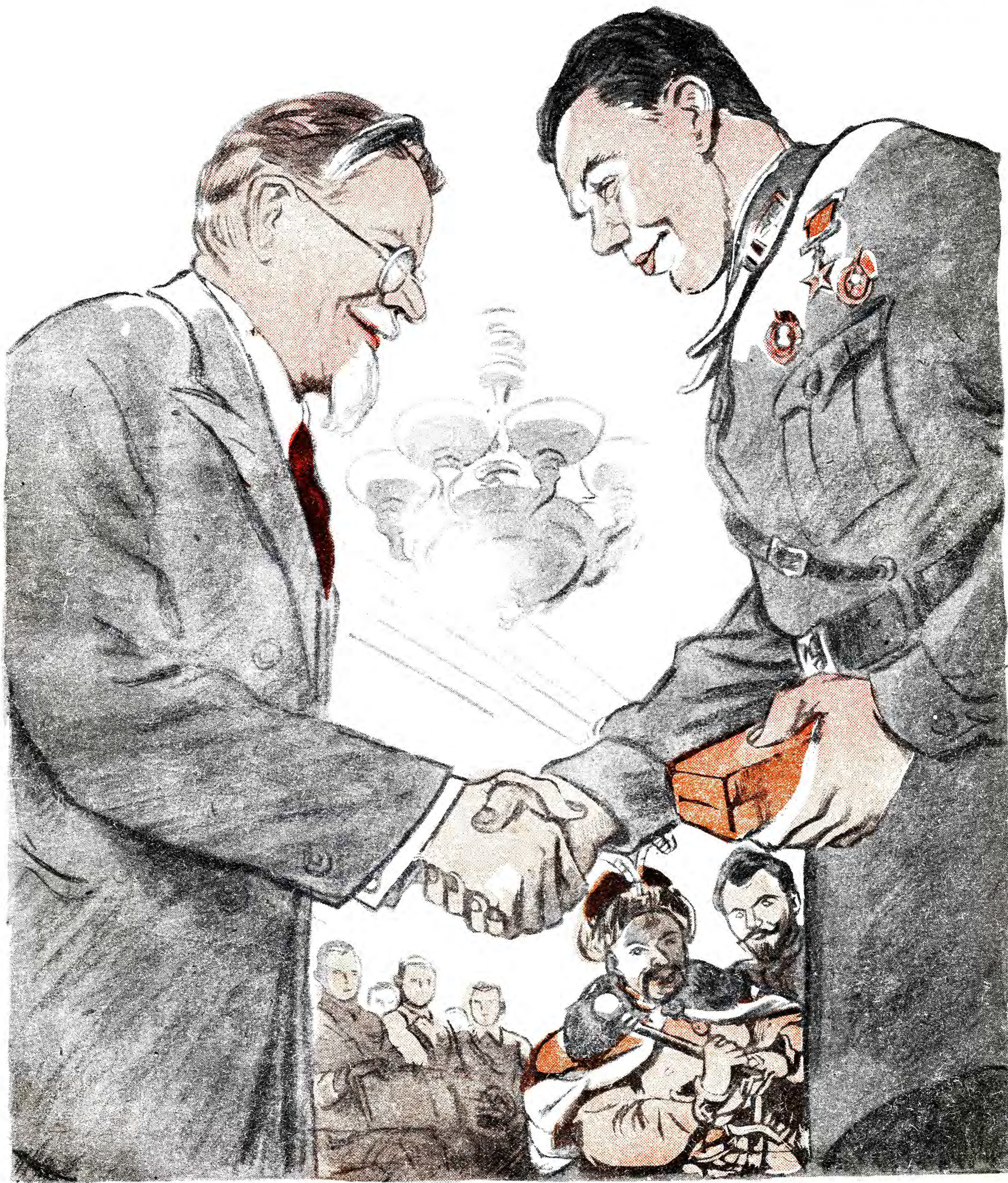
БОГДАН ХМЕЛЬНИЦЬКИЙ (до Щорса). — А цей козак хто буде? ЩОРС. — Молодчий син українського народу.