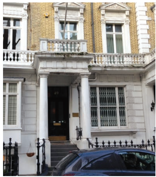
Будинок Союзу Українців у Великій Британії. 49 Linden Gardens, London W2.