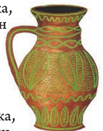
Глечик, село Бубнівка, повіт Гайсин