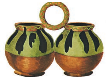
Близьнюки, село Бубнівка, повіт Гайсин