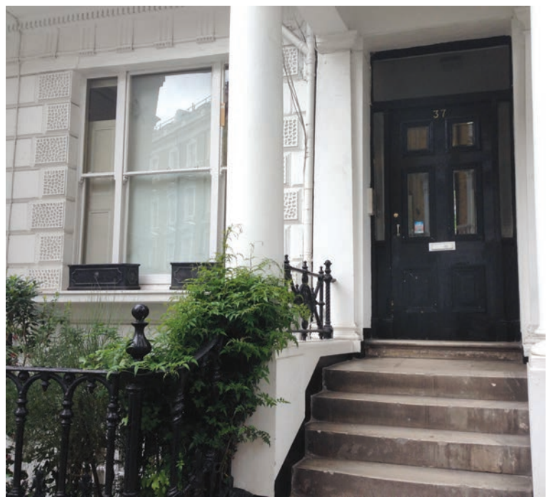
У кімнаті нижнього поверху цього будинку мешкав Вадим Щербаківський. 37 Linden Gardens, London W2.

та князем Яном Токаржевським-Карашевичем поділився споминами про відомого історика, громадського і державного діяча, якого знав ще з Києва, разом працював в УВУ в Празі та Мюнхені 29 .