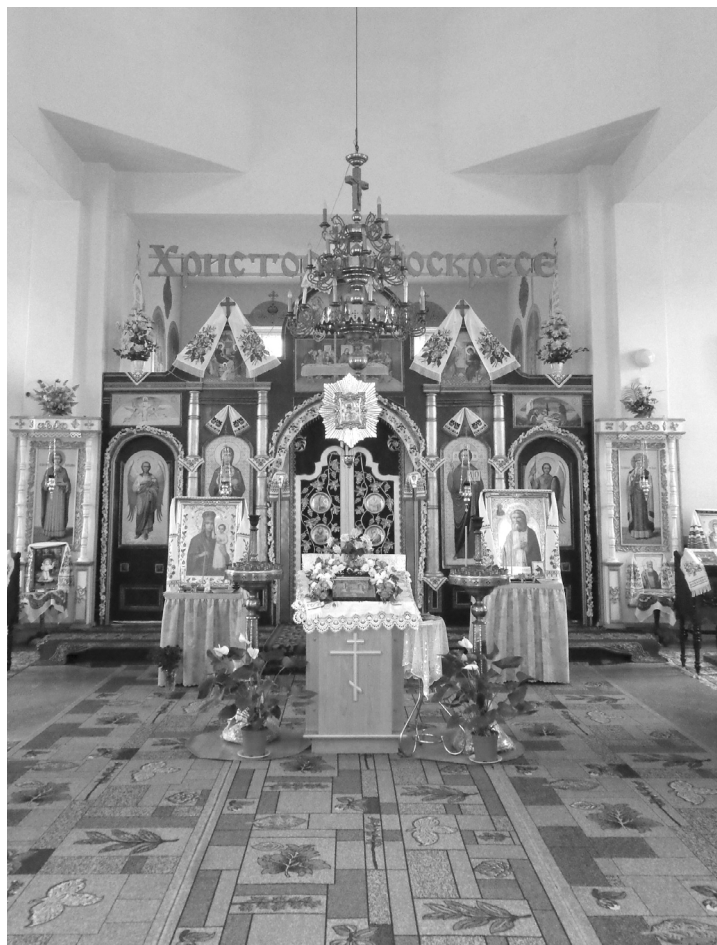
Церква Різдва Богородиці в Горбовому. Сучасне фото