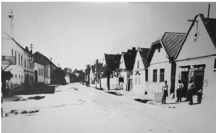
Санкт-Маргаретен. 1957 рік

яким би те не було: чи щасливим, чи гірким. Франциска не забула нічне страхіття, хоч би й хотіла, проте за клопотами про дітей незчулася, як дні хутко збіглись у тижні. Світ, що її оточував, змінювався просто на очах. Годі було збагнути, як непримітні вулички з криницями попід дворами, дерев'яні тини, обриси хат — усе розцвіло, захлинувшись несподіваною ніжністю. Франциска не впізнавала Горбова й тішилася тим змінам, як мала дитина, бо так серцю було значно спокійніше. Страхи вивітрувалися, перше враження обростало молодою зеленню, шок малів, хоч і не зникнув остаточно. Особливо чомусь припала до душі чужинці черемха в кінці городу, при самій межі. Як вона там і опинилась і навіщо господарі лишили височеньке дерево, що давало помітний затінок на городину (а то далеко не завжди користь), — хтозна. Однак як тільки перші сутінки лягали на Чернігівську губернію,