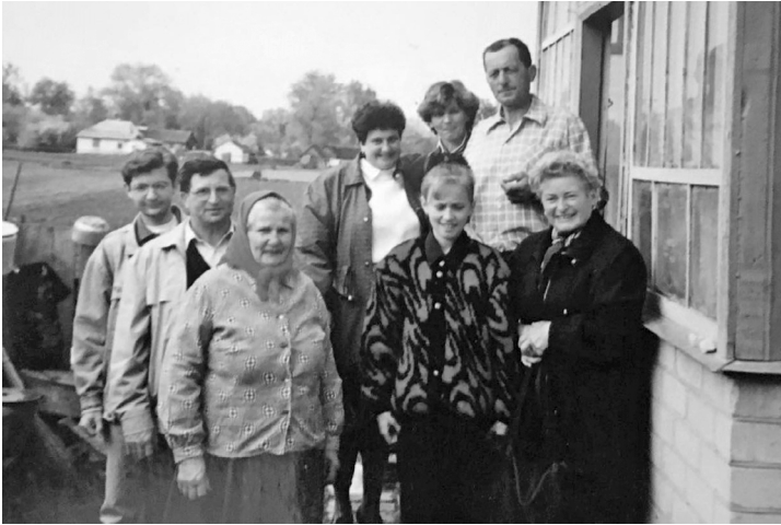
Гості з Австрії. Горбове, 1996 рік