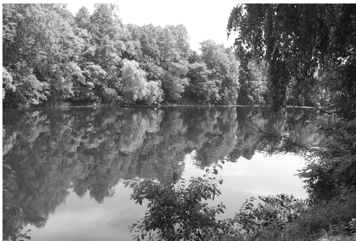
Улюблене місце відпочинку горбівців — озеро Ледань, сучасний вигляд.