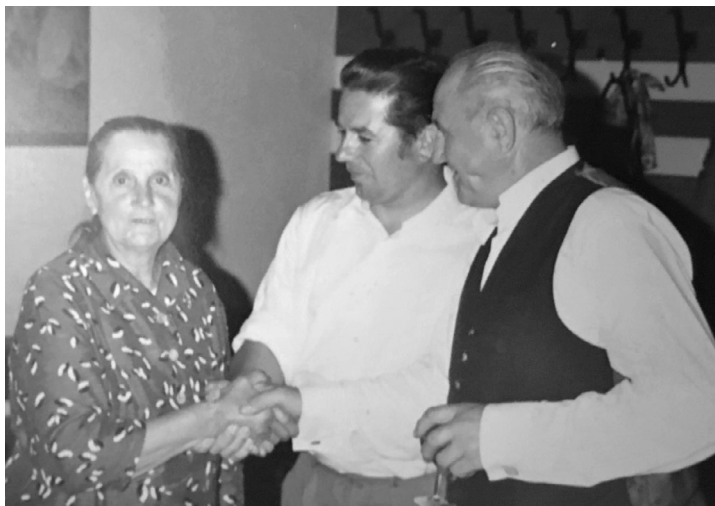
Знову в Австрії. 1970 рік