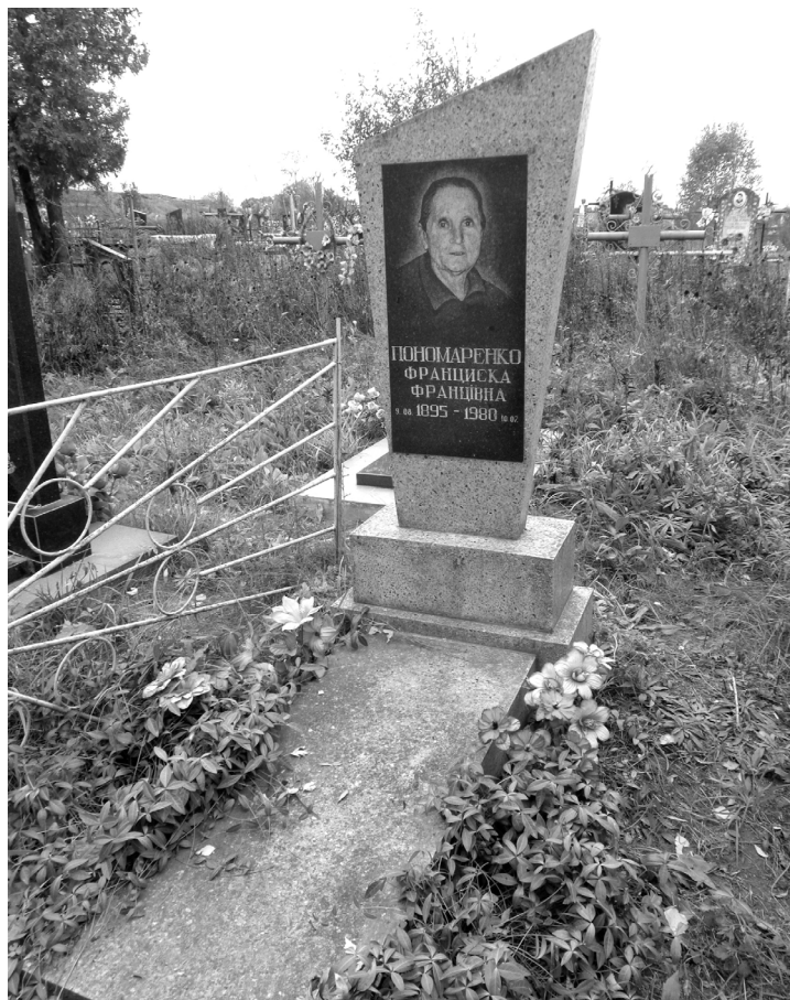
Могила Франциски Францівни Цайтлер-Пономаренко в Горбовому. Сучасне фото