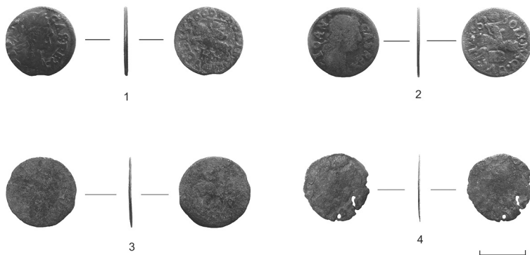
Рис. 1. Соліди Яна Казимира II