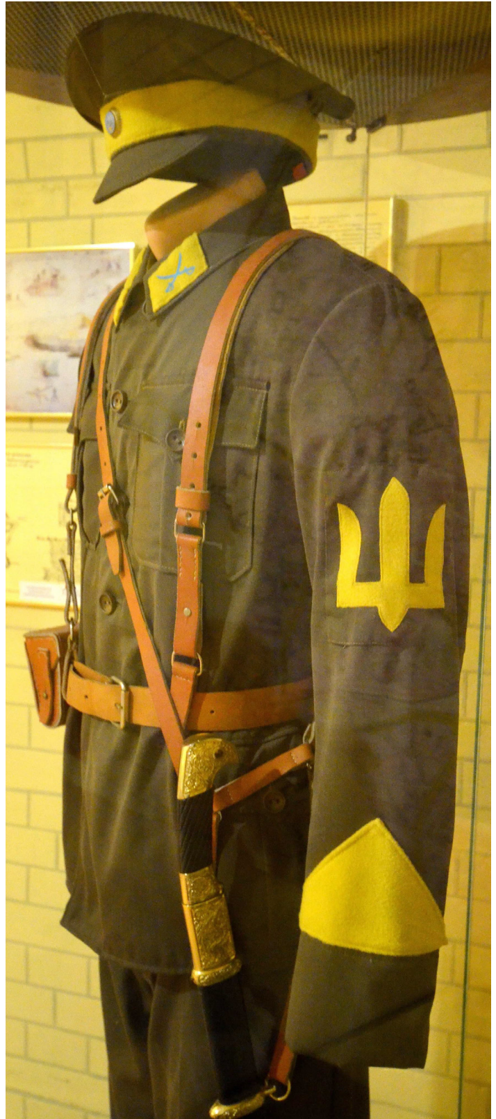
Рис. 8, 9