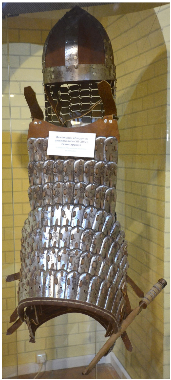
Рис. 1, 2