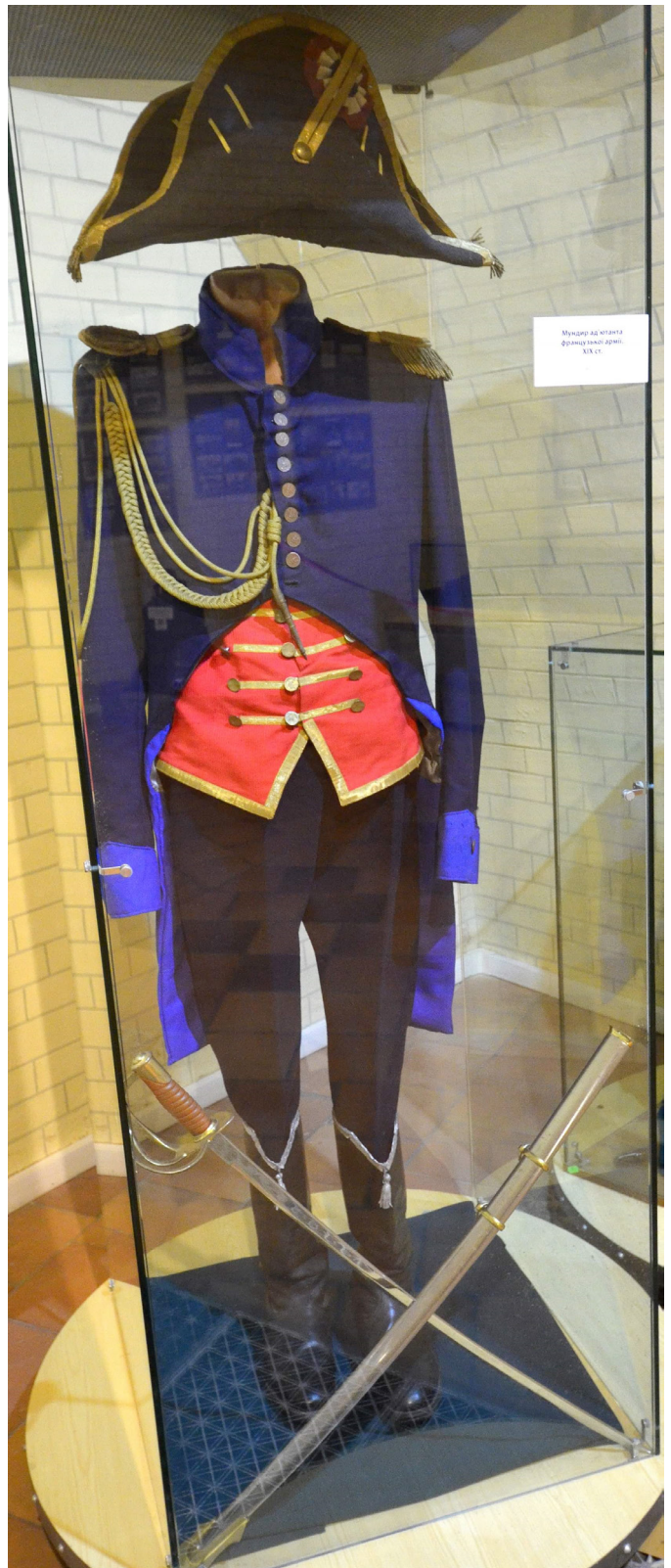
Рис. 6, 7