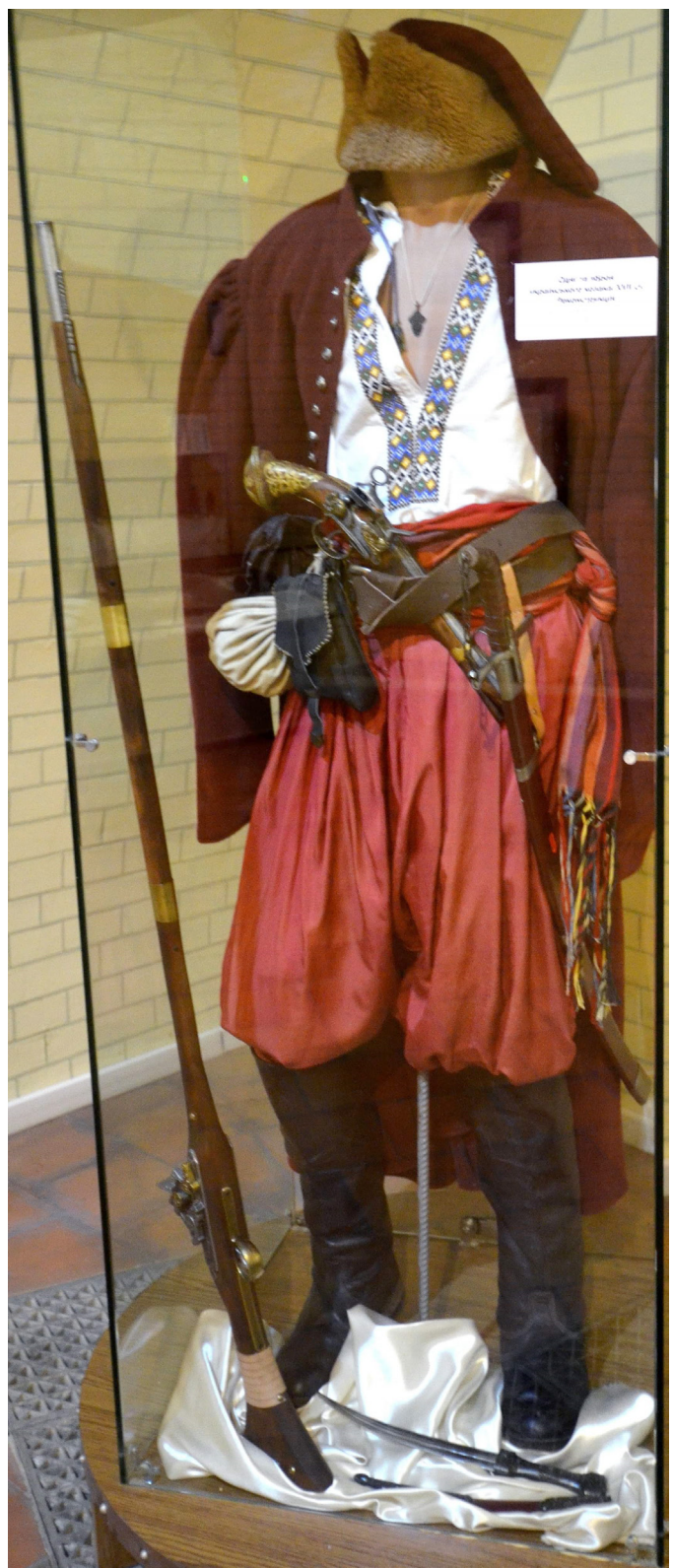
Рис. 3, 5