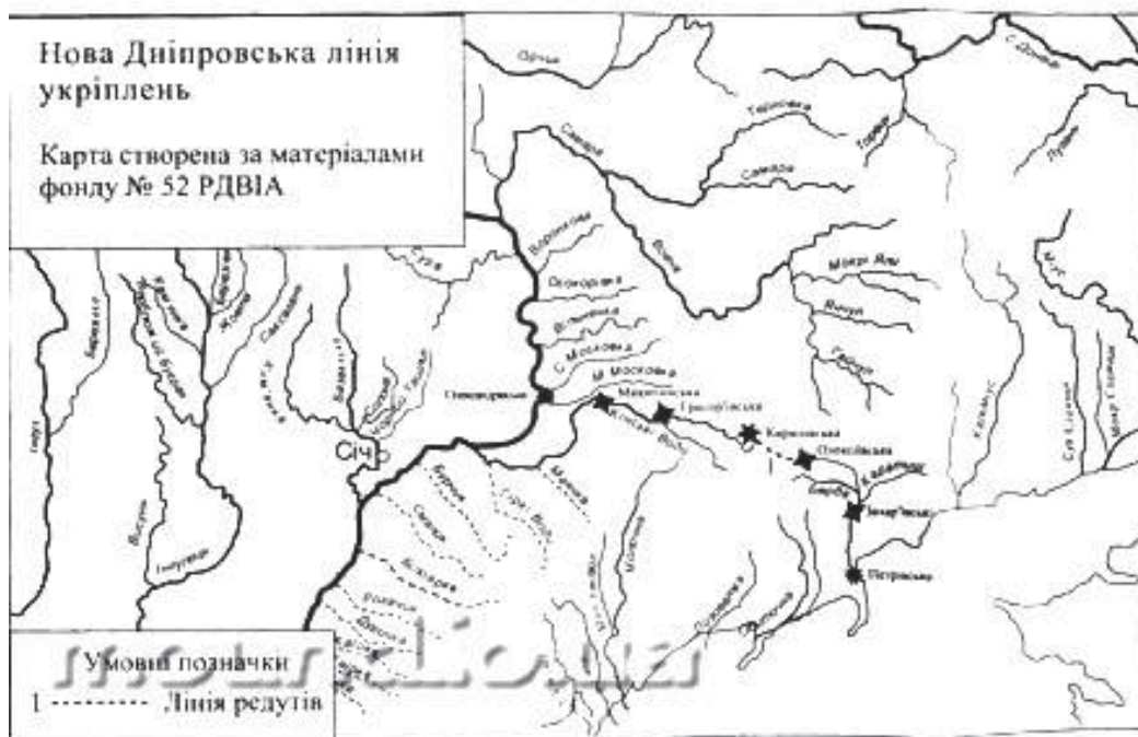
Рис. 1. Нова Дніпровська лінія укріплень.

Саме такого вигляду Лінія повинна була набуті після завершення будівництва.