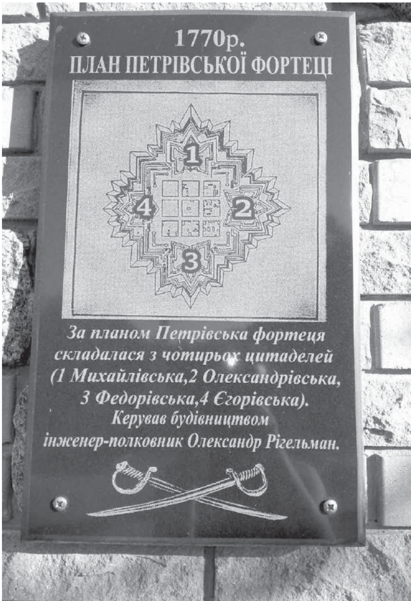
Рис. 3. План Петрівської фортеці.