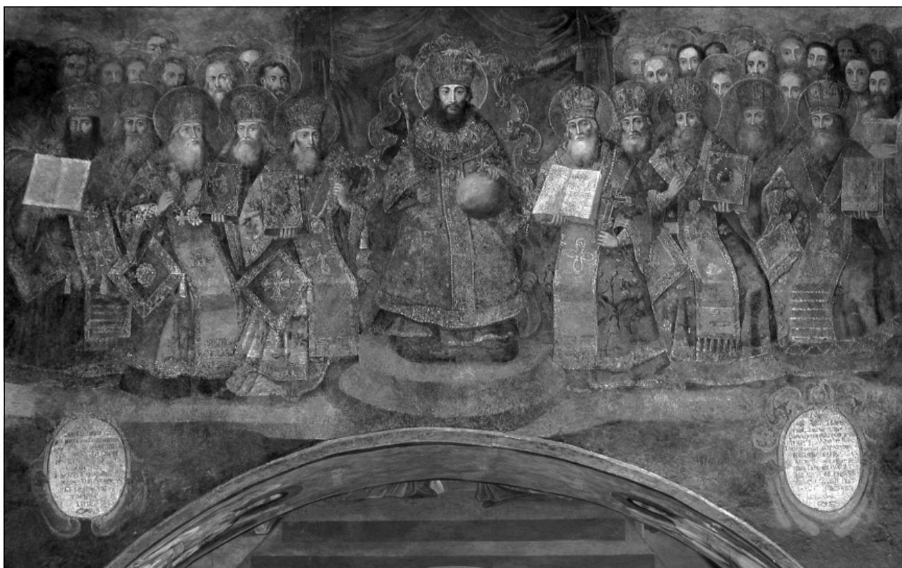
Іл. 1. Композиція «Перший Вселенський собор» у Софії Київській

версалом від 17 травня 1696 р. монастир отримав право утримувати перевіз через річку Десну поблизу Ковчина [18]. У 1703 р. гетьман підтвердив за обителлю право на озеро Расине [7, арк. 1]. Усе це сприяло поліпшенню фінансового забезпечення резиденції київського митрополита.