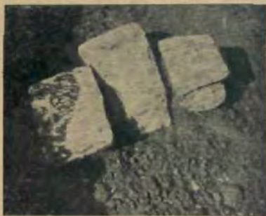
Викопане біле тесане каміння, здається, з придвірної церкви св. Спаса.

інж. Туркевичем на львівській політехніці, виявила, що був він вироблений із чистої березової кори та служив, мабуть, до лікувальних або косметичних цілей. Вона ствердила теж, що він незвичайно старий і може походити навіть із княжих часів.