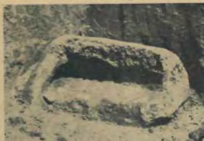
Найліпше збережені останки глиняної кухонної печі з княжої доби.

Мабуть, за останки хат-землянок треба вважати численні о г н и щ а , а вже напевно на колишні хати вказували б останки п е ч е й (14), де дно-чирінь було звичайно виложено ріняками, а зверху вимашене глиною (те саме подибуємо ще й тепер у сільських пекарських печах, і то, н. пр., таксамо в Галичині, як і на Волині); на одному із огнищ нашлося круглий жорновий камінь, з дірою посередині (теж зовсім подібний до теперішніх). Окремо у трьох