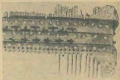
Кіст'яний гребінь із прорізними для прикраси хрещиками.

Між масою побитого черепя найшлося теж кілька менших цілих посудин, між ними — невеличка банька, наповнена дьогтем. Хемічна аналіза, зроблена