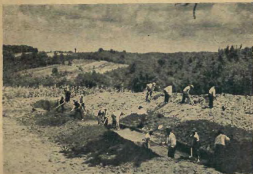
Розкопи на „Золотому Тоді” влітку 1938. р.; на західньому півні — полє „Юрівське” та „Данилівське”, де за княжих часів стояли монастирі.

3. княжий терем був поверховий (горниця — кімната нагорі), при чому мешкальні кімнати, між ними й купальня з ванною, були нагорі, а в долині були репрезентаційні кімнати, де відбувалася „дума” — княжа рада, де приймали закордонних послів і визначних купців та де справляли бенкети.