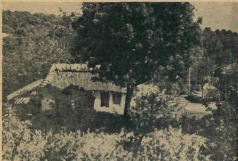
Селянська хата по східньому боці „Золотого Току” у Крилосі.

Город був доступний тільки від півдня, і з тієї сторони було пригороддя, тепер поле „Качків”, а серед нього „Галичина Могила”. Від півдня пригороддя хоронив потрійний вал, а по його північній стороні інші, подвійні вали боронили приступу до властивого городу. Тут знову південну частину займала Богородична катедра з єпископською (відтак митрополичою) палатою, а в північній частині, на самому кінці скелистого хребта горбовини, був — „Золотий Тік”, де стояв княжий двір та біля нього — придвірна церква св. Спаса. Тут тягнеться тепер селянський горід, не цілих два морги за-