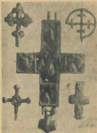
Бронзові хрещики, найбільший із них, здається, з XI в.

Та найбільше з усього нашлося на „Золотому Тоці” черепа із глиняного кухонного посуду — його викопано там коло півтора тони — воно є найкращою хронологічною вказівкою для історії заселення цього місця. І так, дуже мало є черепа з XI ст., найбільше його — із XII—XIII ст., пізніше, із XIV ст. є його знову мало, а з XV ст. та з пізніших часів його зовсім немає. З цього ви-