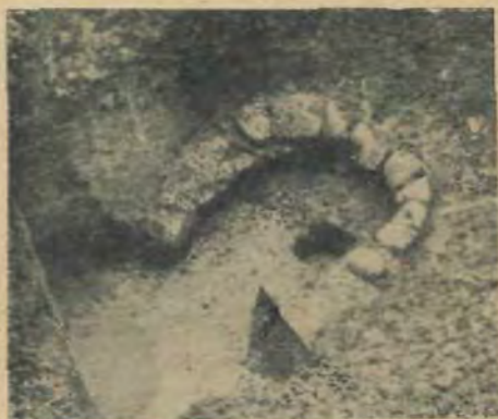
Останки мурованої кухонної печі з княжої доби.

Вал насипаний майже виключно із чорної землі, із незначними прошарками жовтої глини. В ньому в середині немає для скріплення жадної дерев’яної конструкції, а тільки місцями подібуються купки ріняків та дуже мало нетипових черепків княжої доби. На одному місці, вже в насипі валу, виринуло досить велике вогнище, яке могло поветати, як що до чого, підчас сипання валу в зимову пору.