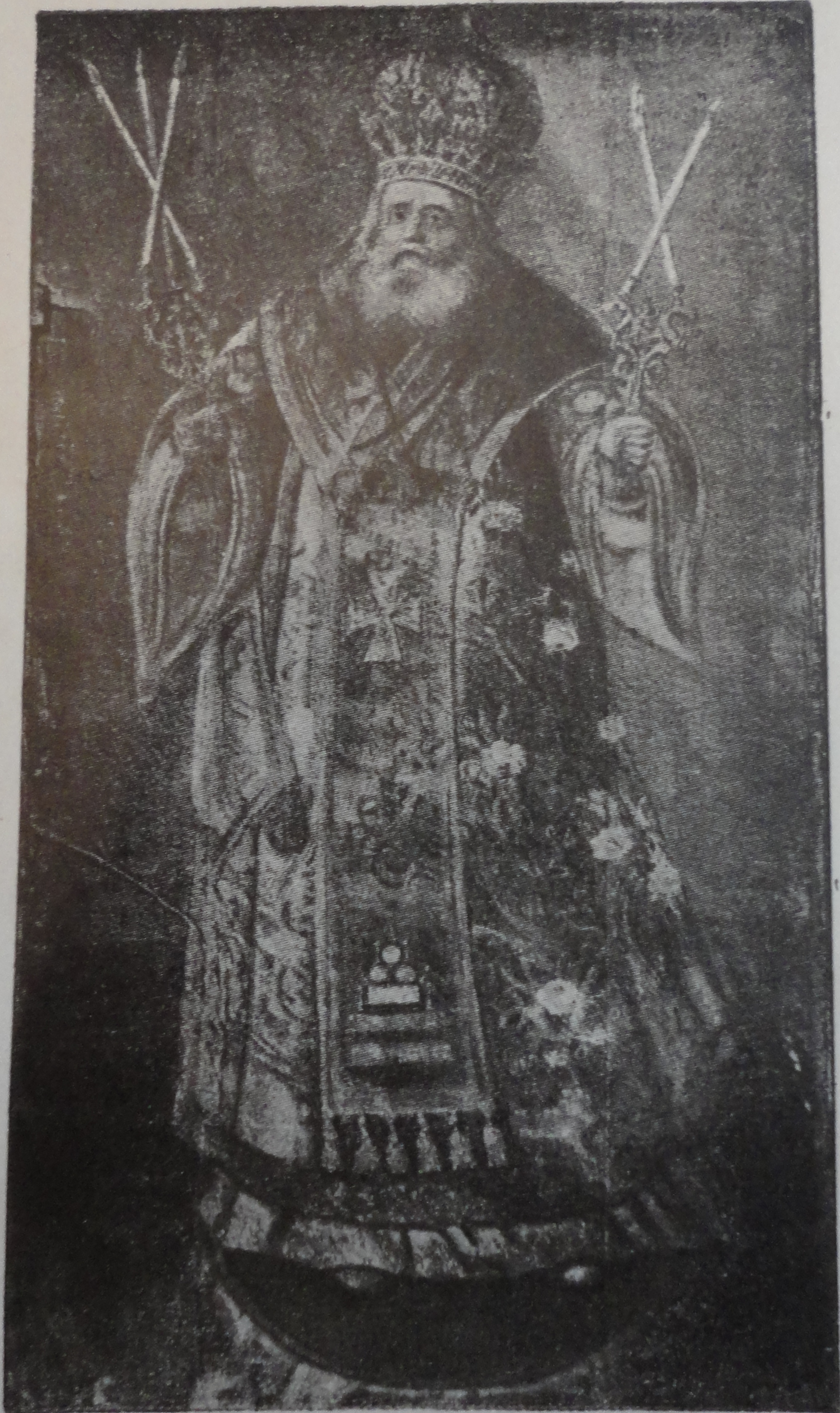
Патріархъ Константинопольскій Серафимъ II.