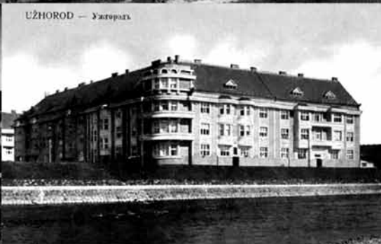
UŽHOROD — Ужгород.