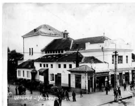
Uzhored - Ужгород