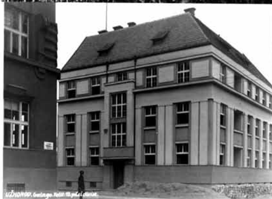
1921년 9월, Gwangju, Korea. 18.9월 1. 1921년