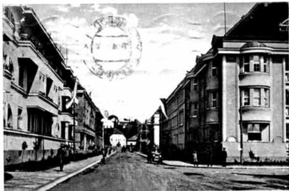
Uzhored. - Ужгород.