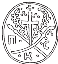
Печатка Костянтинівської сотні 1753 – 1758 рр.