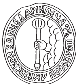
Печатка Лубенської полкової канцелярії 1754 – 1773 рр.