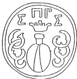
Печатка м. Старих Санжарів 1747 – 1763 рр.