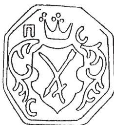
Печатка Синявської сотні 1747 – 1761 рр.