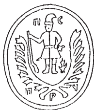
Печатка Роїської сотні 1751 – 1779 рр.