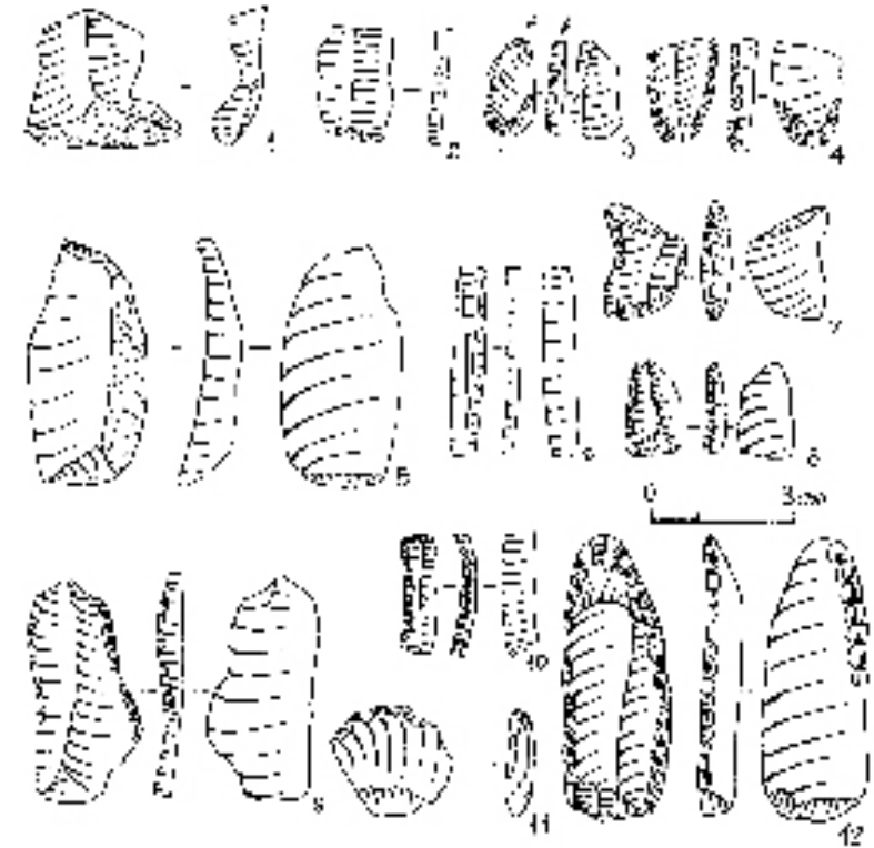
Рис. 3. Кремінні вироби: 1–2 – Львів VII; 3–4 – Львів VIII; 5–7 – Розвадів II; 8 – Підгородці III; 9–12 – Верин VIII.

Очевидно, заселення навісу Підгородці III у добу мезоліту та