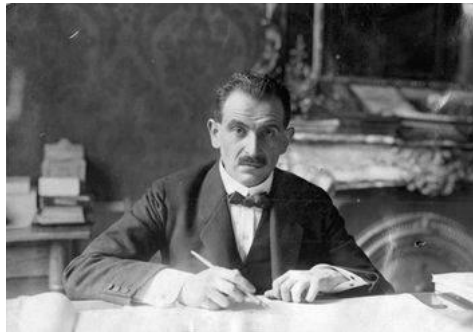
Отто Бауер Світлина 1919 р.

Інший представник австромарксизму – О. Бауер (1881–1938), праці якого вважаються найгрунтовнішими теоретичними дослідженнями з національного питання у марксизмі 13 . У свій час О. Бауер займав посаду секретаря СДРПА, міністра закордонних справ Австрійської республіки. На формування його світогляду вплинули події Першої Світової війни та Лютневої революції, під час якої австрієць перебував у військовому полоні в Росії. Саме тут О. Бауер написав фундаментальну філософську працю «Світова картина капіталізму» ( Das Weltbild des Kapitalismus , 1924 р.) 14 . Осмислюючи досвід