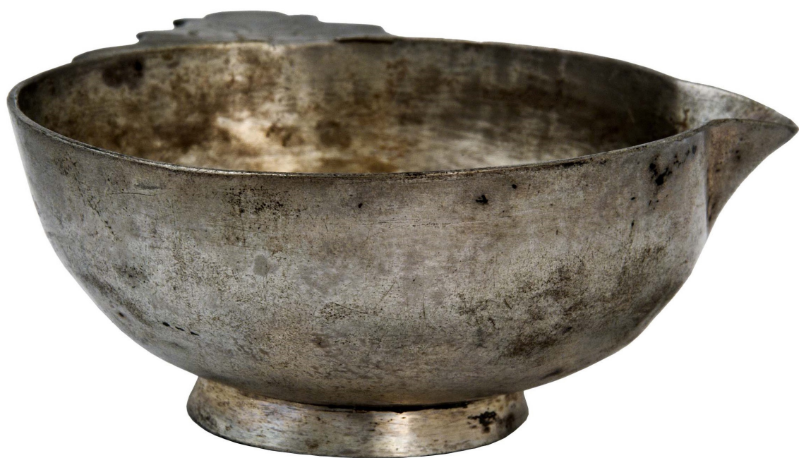
Рис. 5, 6