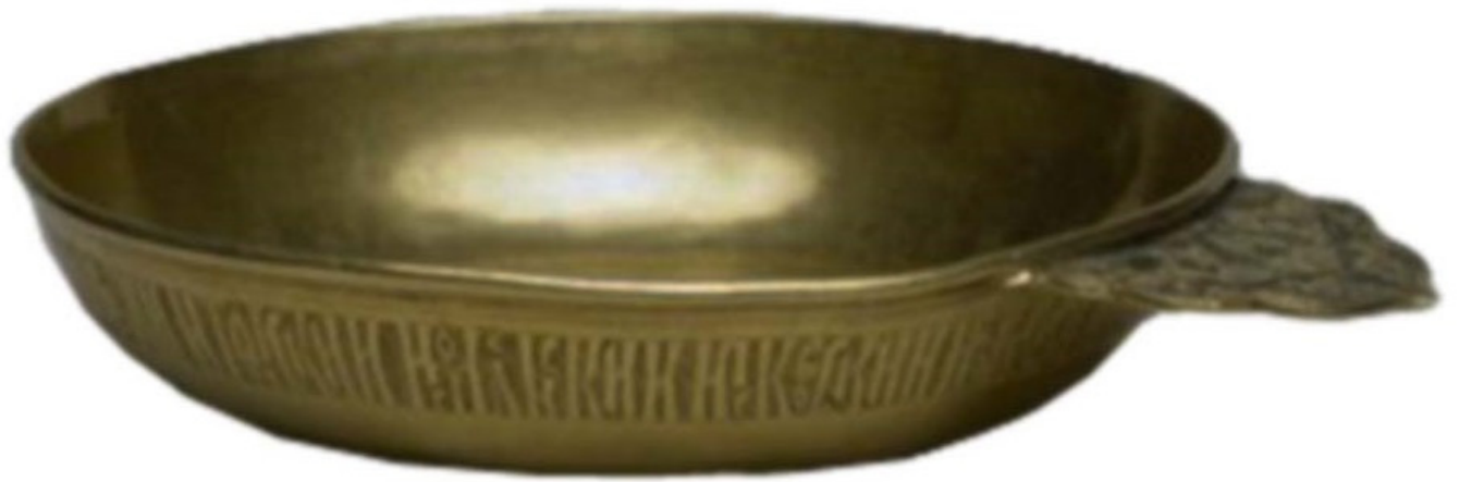
Рис. 1, 2