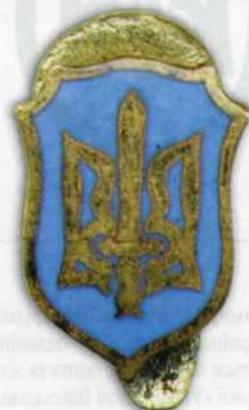
Рис. 12, г