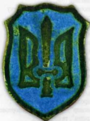
Рис. 12, а