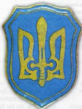
Рис. 12, в