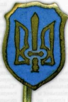
Рис. 12, б