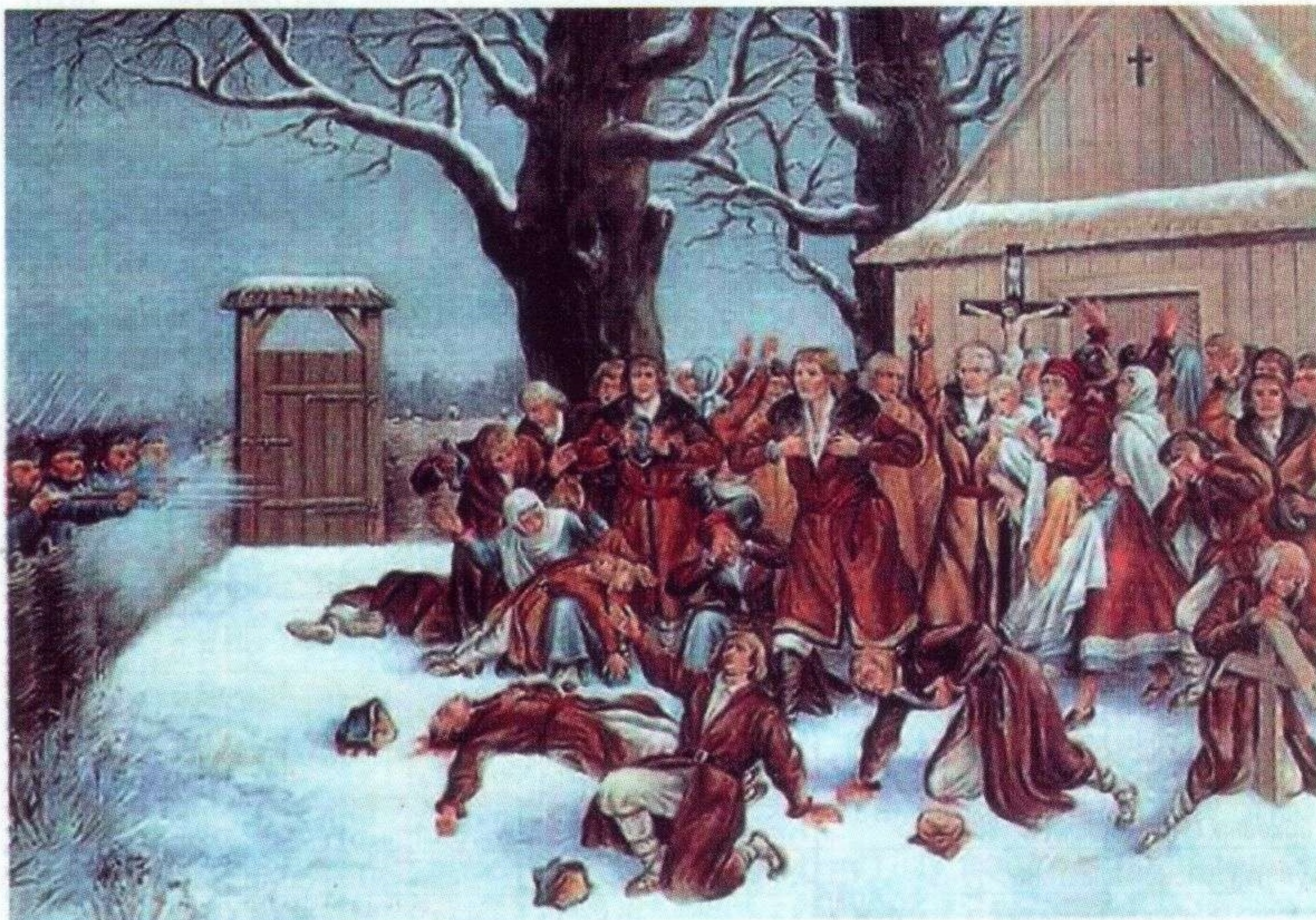
Розстріл селян с. Притулин 26 січня 1874 року російськими солдатами