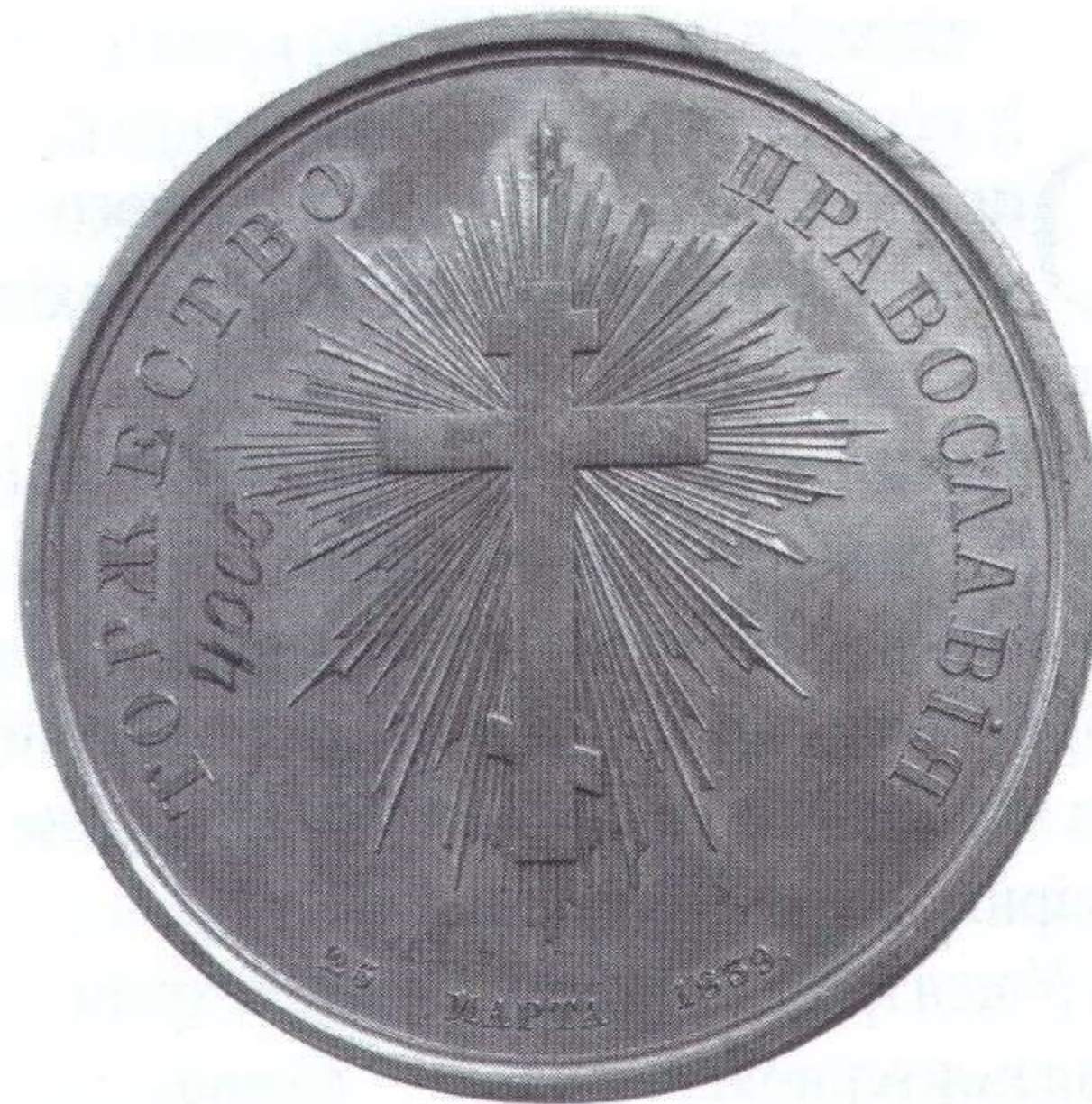
Памятна медаль на згадку про селян сіл Притулин, Дрелів та Полубичі на Холмщині, розстріляних російськими військами за відмову переходу на російське православ'я.