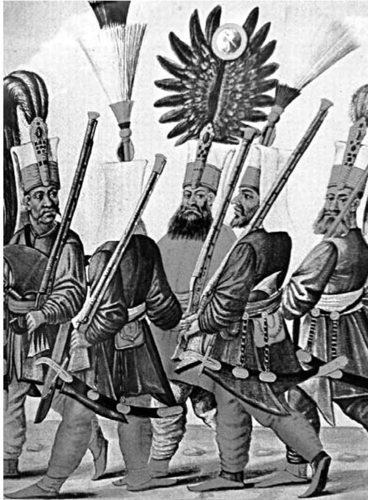
Мурад IV з яничарами на давній гравюрі