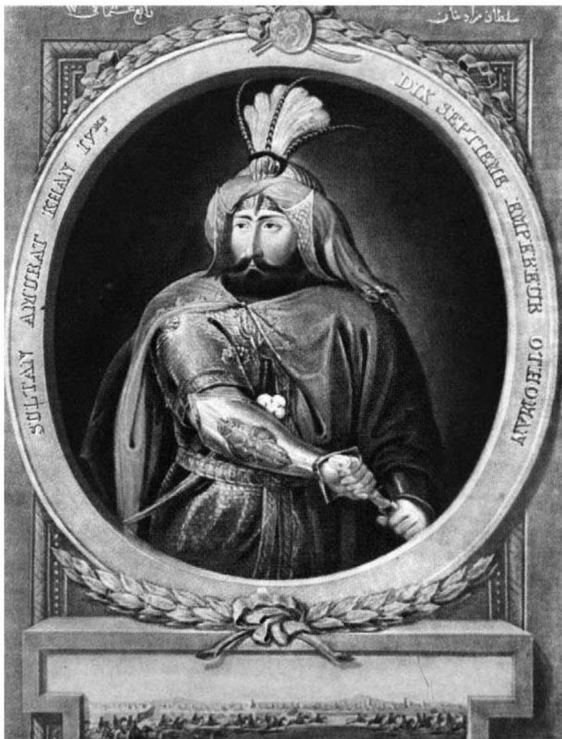
Султан Мурад IV