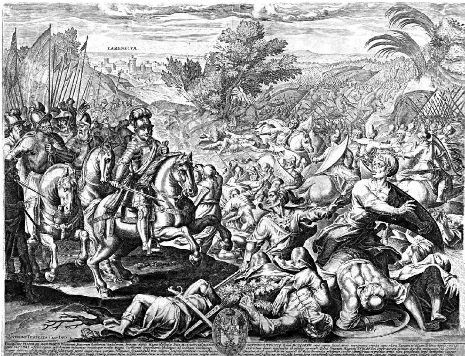
Перемога короля Владислава IV під Кам'янцем (гравюра учня школи Франческо Вламена)