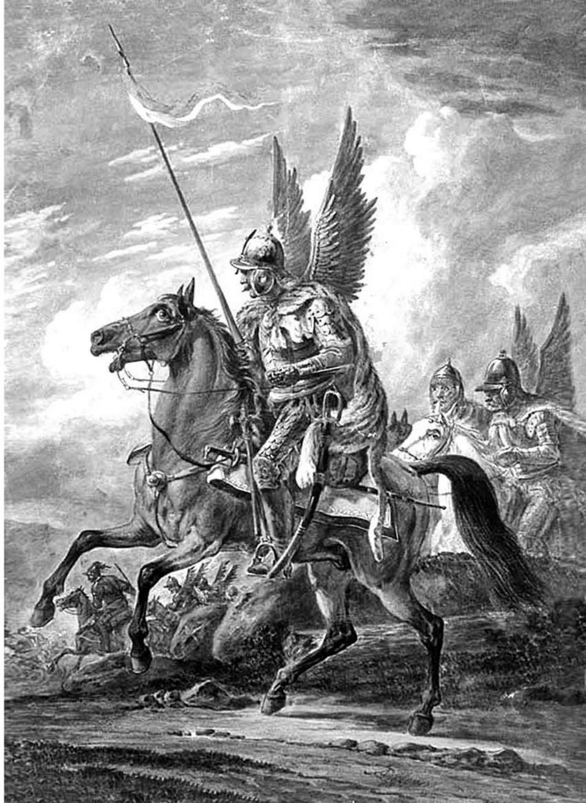
Польський крилатий гусар