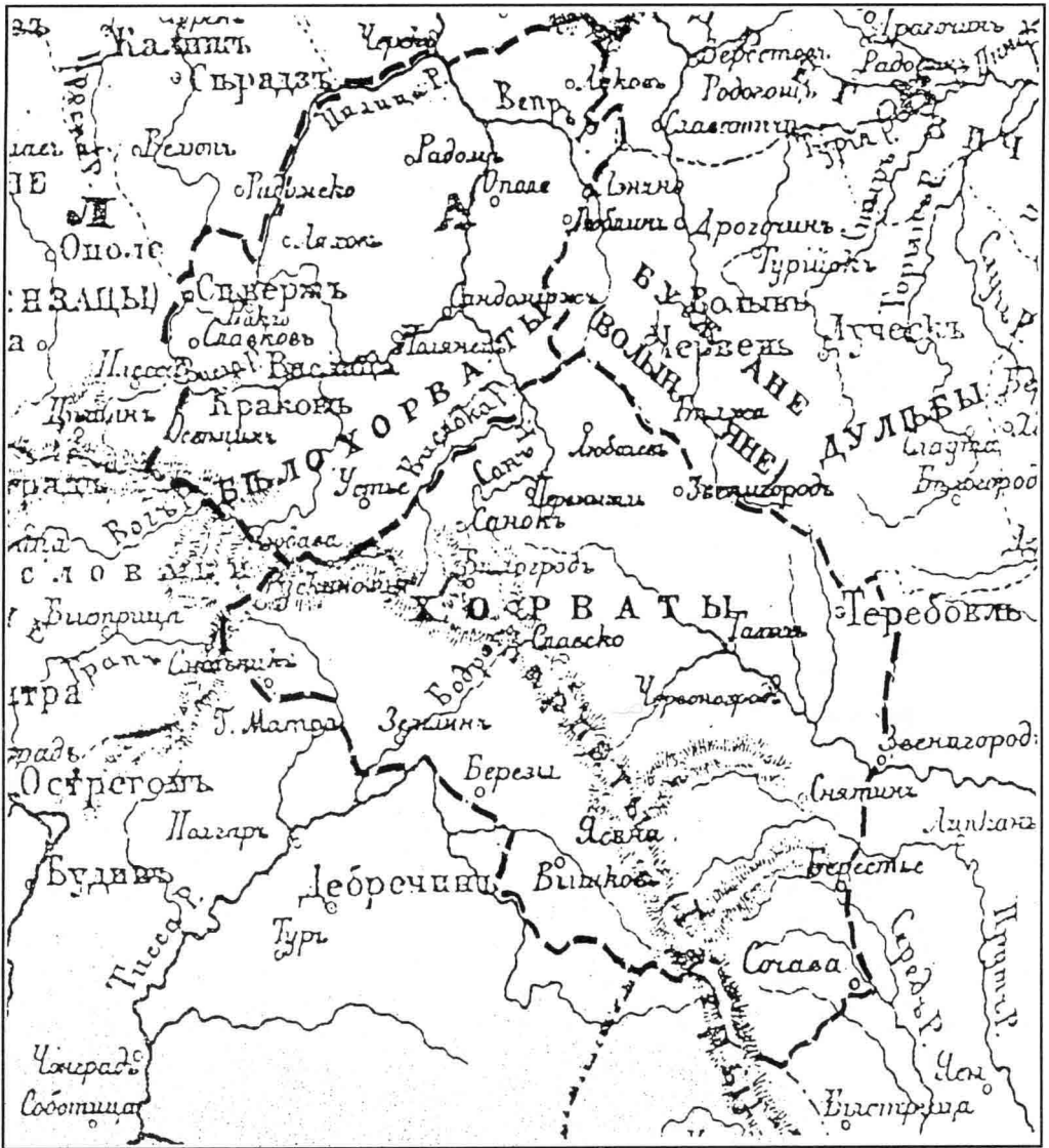
Рис. 2. Хорвати у атласі М. Павлішева.

незначними винятками, виключно проти західних народів [20, с. 49 –51]. Пеленський вважав в'ятичів складовою частиною Хорватського союзу [33, с. 20].