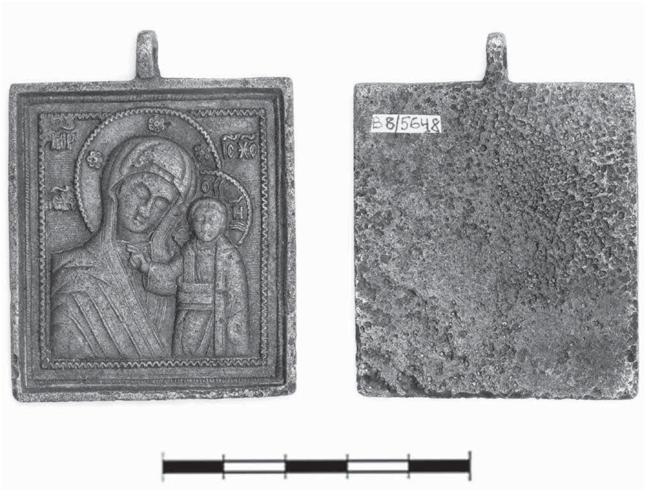
Рис. 3. Іконка Богоматері Одигітрії, XIX ст. (B8/5648).