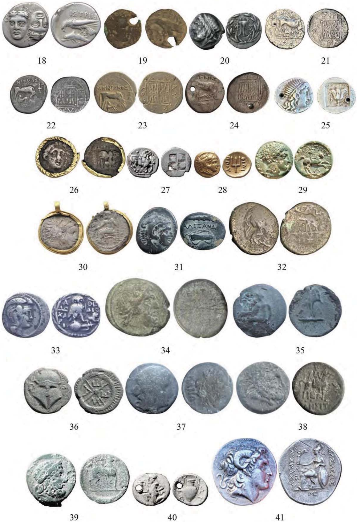
Рис. 2. Монети VI–I ст. до Р. Х., знайдені на території Поділля