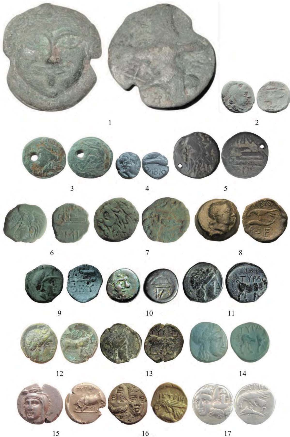
Рис. 2. Монети VI–I ст. до Р. Х., знайдені на території Поділля