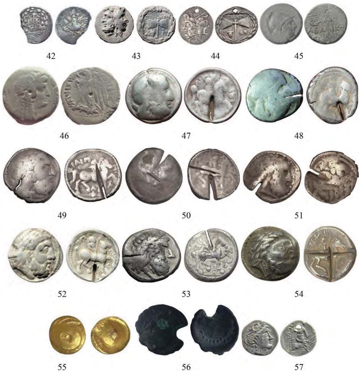
Рис. 2. Монети VI–I ст. до Р. Х., знайдені на території Поділля