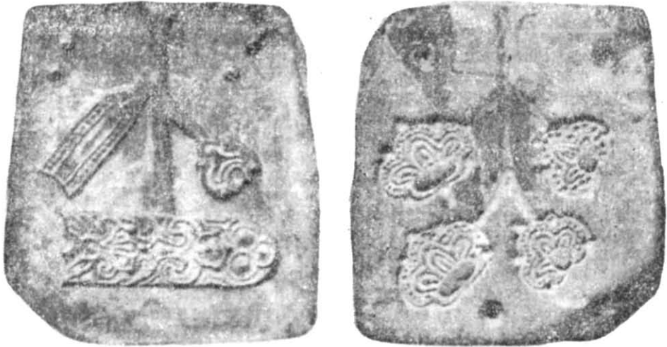
Рис. 1. Формочка № 1 для відливки поясного набору. Лицьова і зворотня сторони.

зово опубліковані формочки привертають увагу своєю унікальністю та цінністю закладеної в них інформації для історії київського мистецтва (рис. 1; 2). Автори публікацій вірно датували знахідку і підкреслили знакову функцію поясних наборів, металеві деталі яких відливались у пірофілітових формочках. Проте вони неточно вказали на типологічну