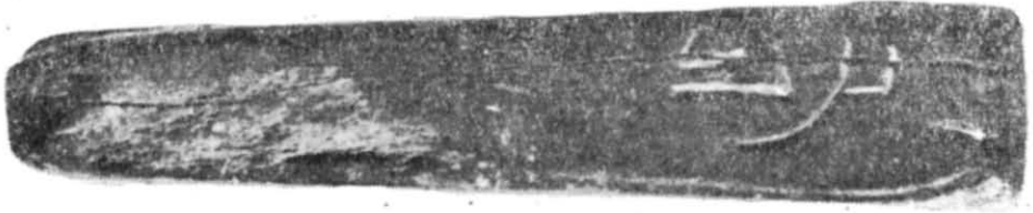
Рис. 3. Напис побажання «Благословення...» на ребрі формочки № 1.

До важливих висновків приводять спостереження над стилістичними та іконографічними особливостями київських ливарних форм. Крім згаданого мотиву багатопроменевої зірки на інших бляшках і наконечнику, відтворено мотиви три-, п'яти-, семипелюсткової квітки. Подібні