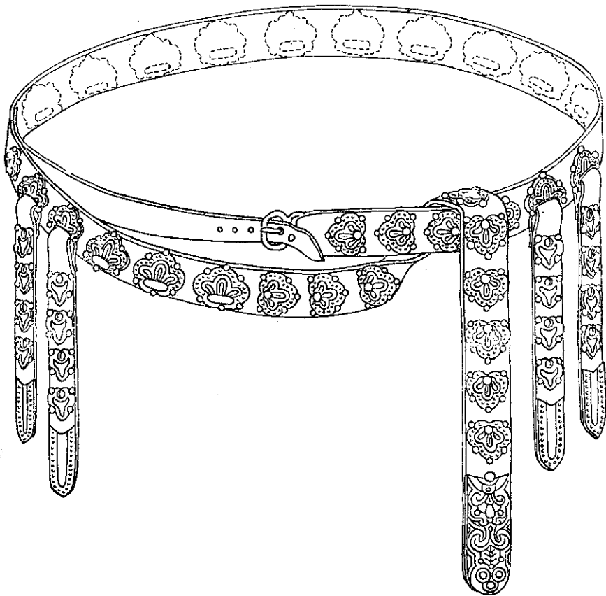
Рис. 4. Пояс с деталями, що відливались у формочці № 1. Реконструкція автора.

появу ливарних форм імітаційного типу, які, за останніми даними, з'явилися в середині XII ст. 37 В імітаційних формах відливалися вироби з свинцево-олов'яних сплавів, а більшість поясних наборів виготовлено зі срібла або мідних сплавів. Аналіз наремінної гарнітури чернігівських ювелірних майстерень свідчить про використання багатьох технологічних прийомів: ливарства, чеканки, золочення, інкрустації тощо.