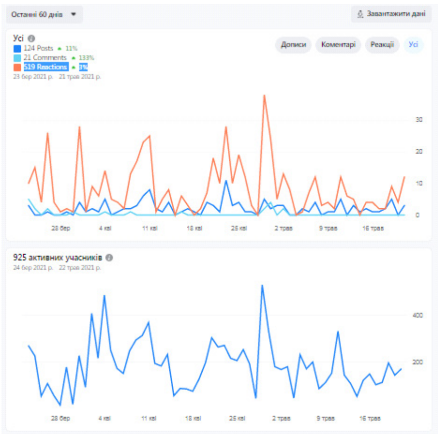
Рис. 1. Завантажені дані (дописи, коментарі, реакції) та активні учасники блогу «Освіта за спеціальністю “Нафтогазова інженерія та технології”» за період 23 березня 2021 р. – 21 травня 2021 р.