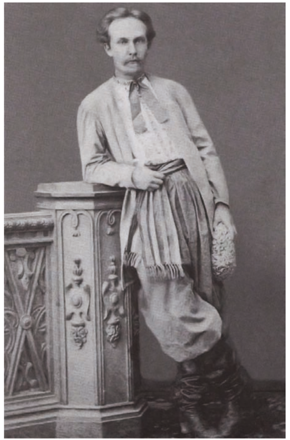
Андрій Лисенко в традиційному українському одязі, у якому він виступав в опері «Різдвяна ніч». 1874 р.

що М. Лисенко носив народне вбрання, однак наголошується, що він полюбляв модний європейський одяг [35, с. 335; 28, с. 158]. Це також підтверджують численні світлини, на яких Микола Віталійович зображений у загальноєвропейському костюмі, 35 таких знімків опубліковано у збірнику спогадів про М. Лисенка [20]. Натомість відомо, що М. Старицький, окрім прийнятого стандарту чоловічого костюма, носив і українське вбрання протягом всього свого життя. О. Лотоцький, учасник громадсько-політичного українського руху, співзасновник видавництва «Вік» у Києві (1895–1918), відзначав своєрідність постаті Михайла Петровича: «Вже своїм зовнішнім виглядом — типовим українським обличчям з довгими вусами, в сивій шапці, в синій чумарці з сивою смушевою оторочкою — се була