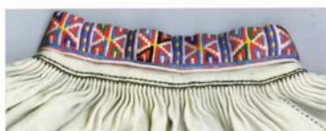
Запозичений «полуботківський» орнамент на комірі і манжеті сорочки зі Смільника кінця 20-х рр. XX ст.