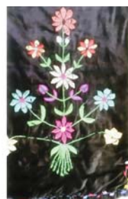
Оксамитовий сардак зі Скородного, оздоблений бісером, 40-і рр. XX ст.