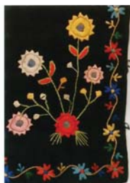
Комірець на оксамитовому сардаці зі Скородного, вишитий гладдю, 40-і рр. XX ст.