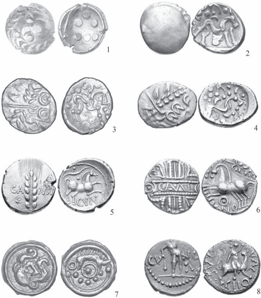
Рис. 3. Зразки кельтських монет.