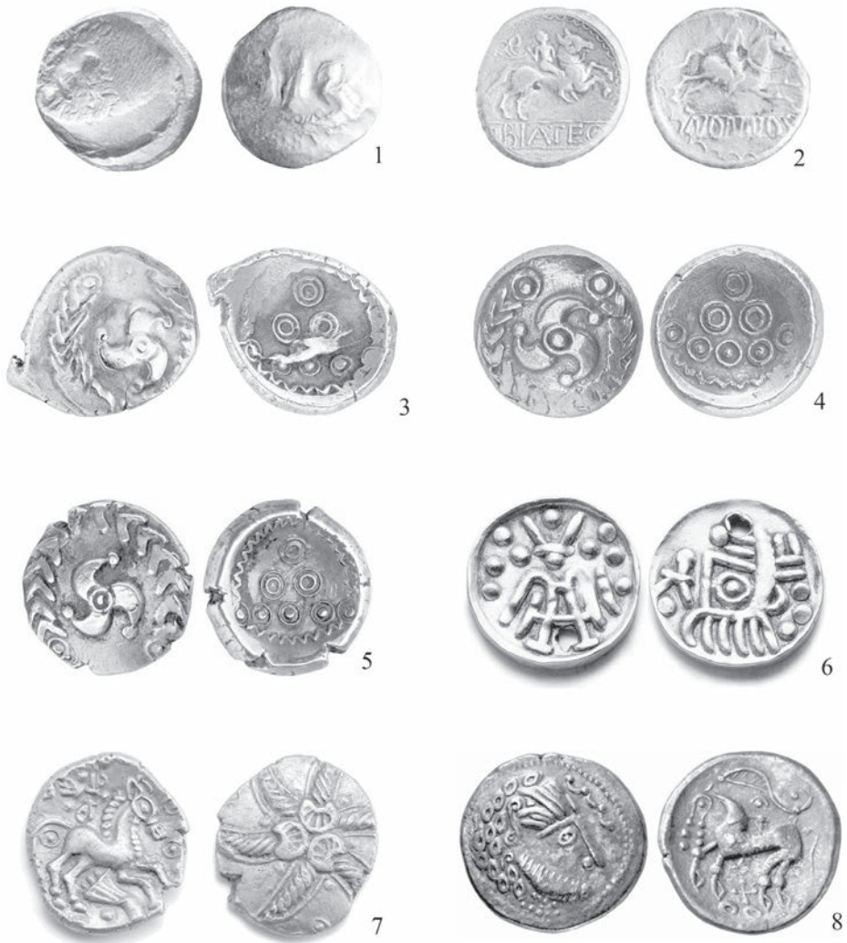
Рис. 2. Зразки кельтських монет.