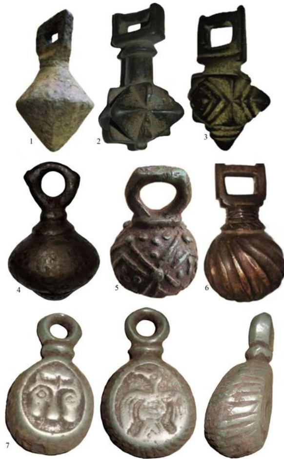
Рис. 2. Бронзові кистені давньоруського часу.