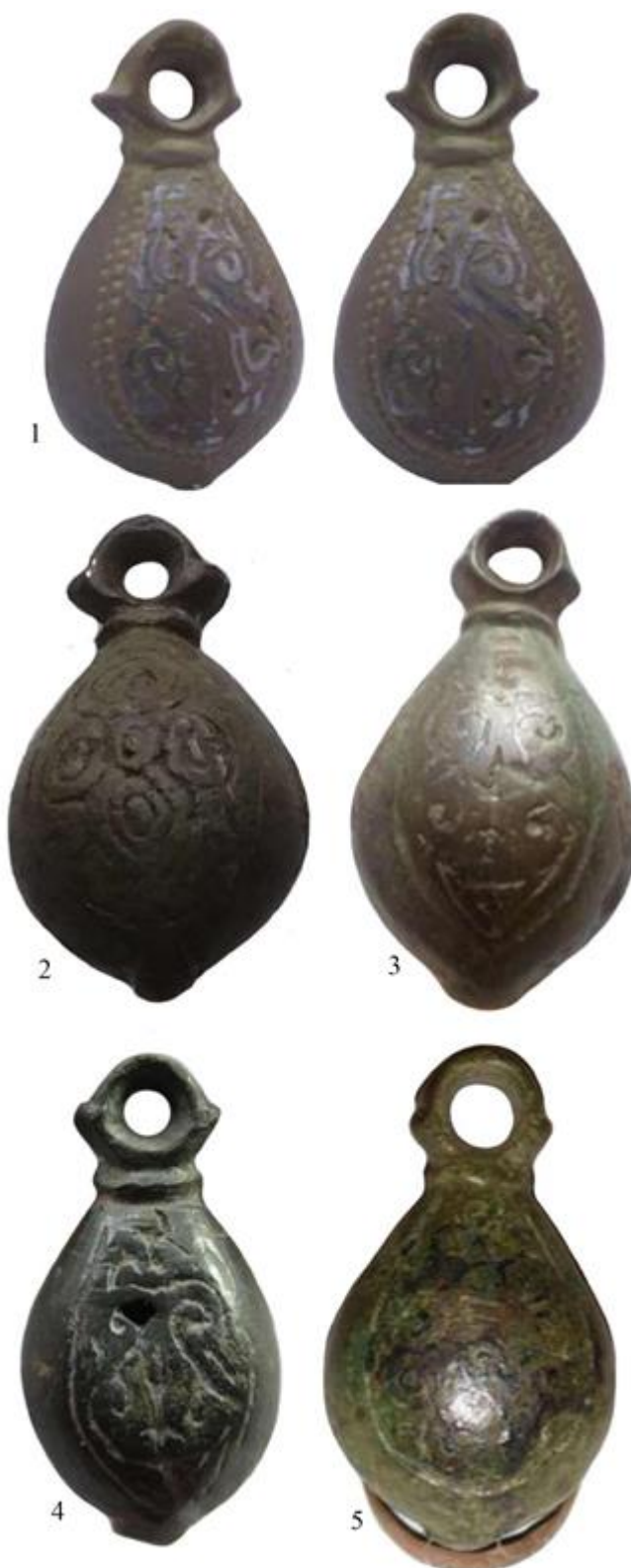
Рис 1. Давньоруські кистені грушоподібної форми.

зазначених артефактів з теренів північного заходу України недостатній, хоча ці землі перспективні для дослідження теми «Види озброєння Давньої Русі». Тим більше, що тут, напевно, існувало власне виробництво багатьох із них.