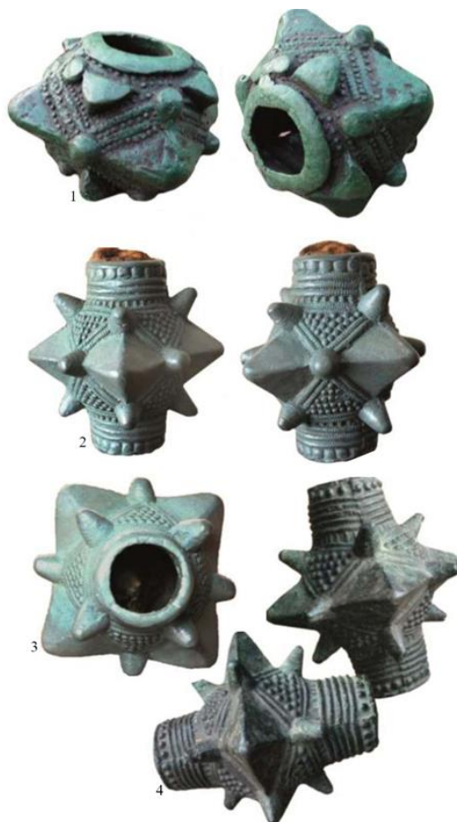
Рис. 3. Бронзові наверхня давньоруських булав.