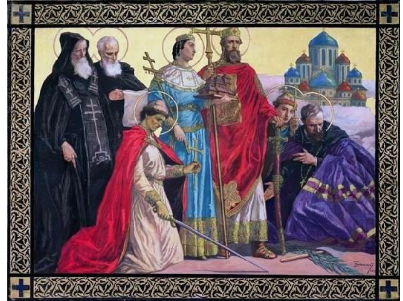
«Святі землі Руської». Йосип Бокшай