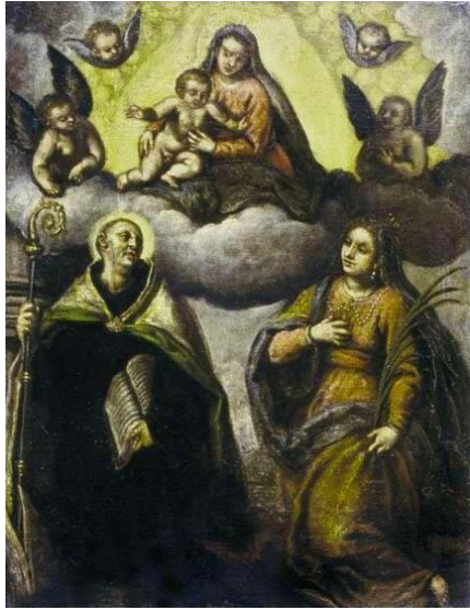
«Мадонна зі святыми». Якопо Пальма-мол.

Огляд картин музею розпочнемо з колекції XVI–XIX ст. Яскравим взірцем Пізнього Відродження є одна з найдавніших робіт колекції, твір видатного італійця (власне – венеціанця) Якопо Пальми-молодшого (1548–1628) «Мадонна зі святыми». Картина виконана олією на полотні розміром 71 на 51 см, але нагадує фреску, кольори сонячні, світяться ізсередини.