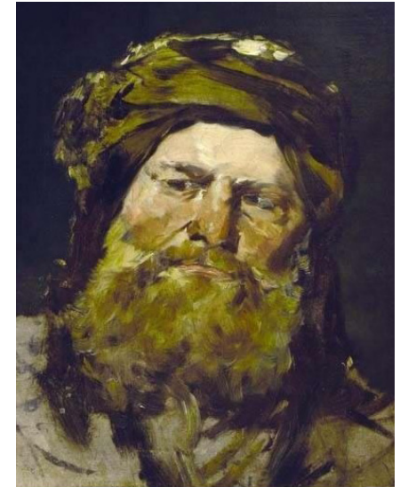
«Голова фарисея». Мігай Мункачі

Музей володіє однією з найбільших і найповніших колекцій угорського мистецтва, що зумовлено історичними чинниками. Адже Закарпаття та угорські землі входили до монархії Габсбургів.