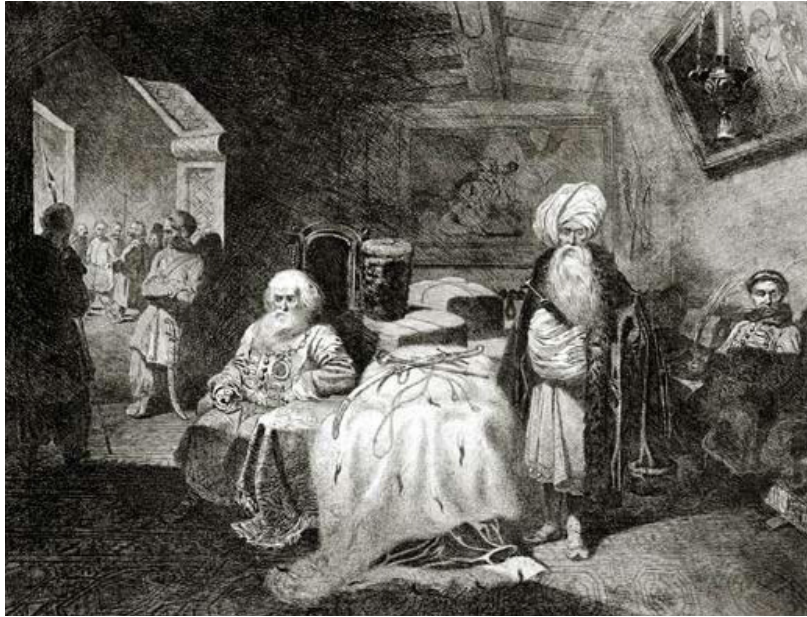
«Дари в Чигирині». Тарас Шевченко

володіння графічною технікою офорта Т. Шевченка називали «українським Рембрандтом».