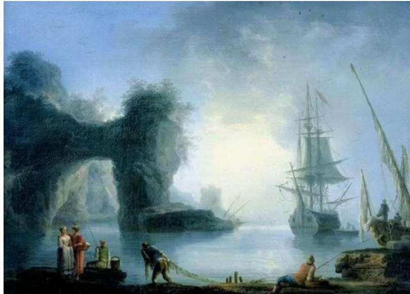
«Пейзаж із гротом». Клод Жозеф Верне

лей, що тануть у прозорому серпанку, застиглу морську поверхню, фантастичні обриси скель.