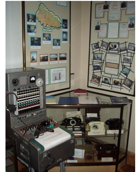
Ручний комутатор та інші експонати музею управління СБУ

Два стенди мають спільну назву «Органи державної безпеки». Раніше на КПП «Ужгород» вилучалися документи ворожої розвідки, а самі розвідники потрапляли під трибунал. На стенді «Війна в Афганістані» (1979–1989) виставлено фо-