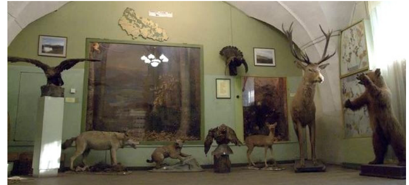
Експозиція відділу природи. Діорама «Буковий ліс» (художники А. Кашшай, З. Шолтес)

Зазвичай розпочинають огляд з експозиції «Природа Закарпаття», що розміщена на першому поверсі головного корпусу Ужгородського замку, займає 6 залів і вражає художніми діорамами. Експонатом європейського значення відділу природи є скам'янілий кістяк риби (тунець), якому бл. 30 млн. років.