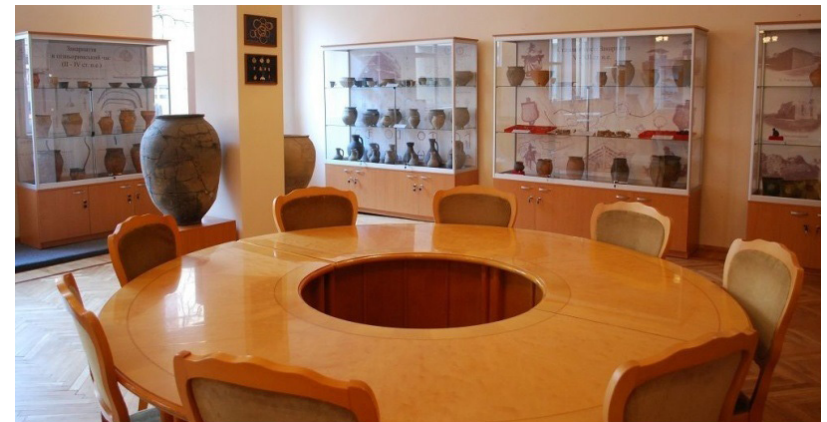
Фрагмент експозиції археологічного музею

В експозиції «Епоха гальштату і латенська культура Закарпаття» представлено вази, миски, глечики III–I ст. до н. е., кельтські прикраси II ст. до н. е. Серед кераміки VII–IV ст. до н. е. інтерес викликає графітова сітула, знайдена в опідумі на г. Галіш-Ловачка на околиці Мукачева. «Дакійські старожитності Закарпаття» – експозиція знахідок I ст. до н. е. – II ст. н. е. з городища в с. Мала Копаня Виноградівського району. Виставлено ліпний кухонний по-