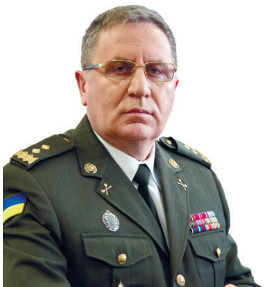
Начальник Національної академії сухопутних військ імені гетьмана Петра Сагайдачного генерал-лейтенант Павло ТКАЧУК