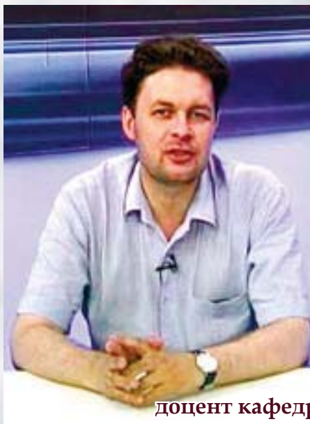
доцент кафедри морально-психологічного забезпечення діяльності військ

Гібридна агресія Росії спричинила нові виклики для Збройних Сил України, на які потрібно дати відповідь у найкоротші терміни. Від ефективності цієї відповіді значною мірою залежить успіх нашої держави у протистоянні агресору.