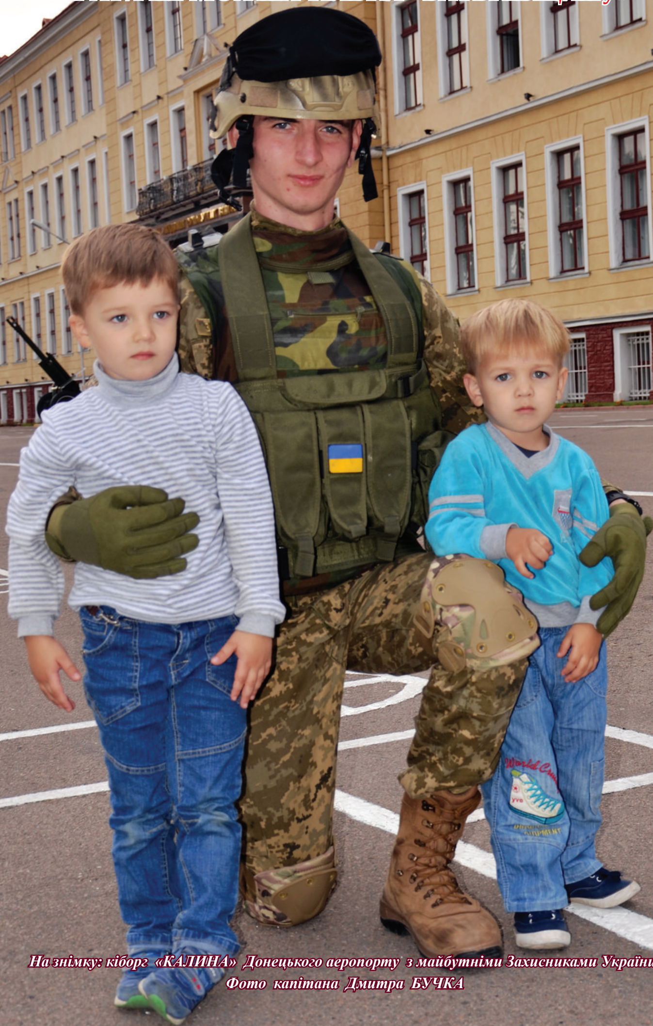
На знімку: кіборг «КАЛИНА» Донецького аеропорту з майбутніми Захисниками України.

«МОЖНА ВСЕ НА СВІТІ ВИБИРАТИ, СИНУ, ВИБРАТИ НЕ МОЖНА ТІЛЬКИ БАТЬКІВЩИНУ»