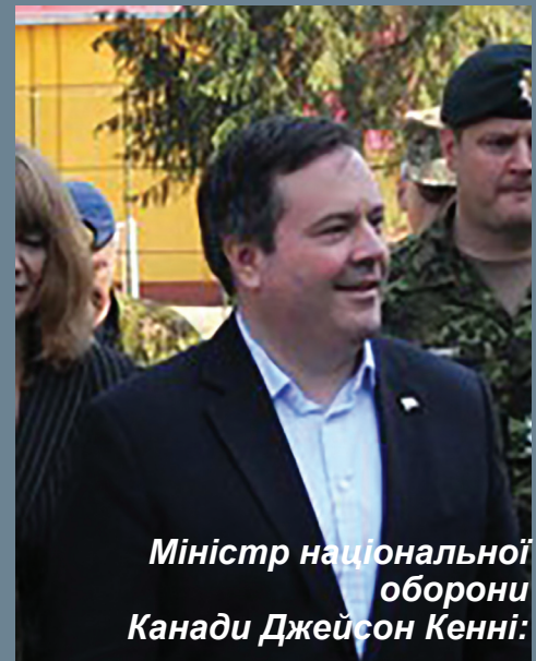
Міністр національної оборони Канади Джейсон Кенні:

«Українські вояки заслуговують на гідну підтримку. І місце для вишколу у вас чудове: Міжнародний центр миротворчості та безпеки»