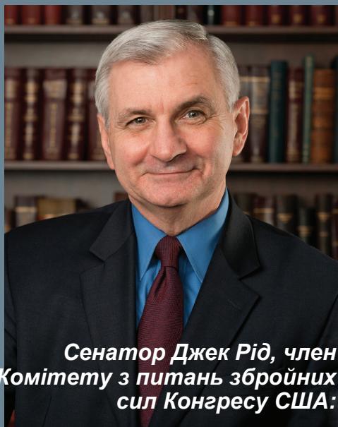
Сенатор Джек Рід, член Комітету з питань збройних сил Конгресу США:

– Я вдячний керівництву Академії за докладну наочну демонстрацію можливостей Міжнародного центру миротворчості та безпеки. Запевняю, що США разом з іншими провідними країнами світу й надалі підтримуватимуть розвиток його навчально-матеріальної бази, інфраструктури. Крім того, ми також вчимося в українців. Адже вони мають практичний досвід участі у бойових діях. Я впевнений, що ми в змозі допомогти Україні захистити себе.