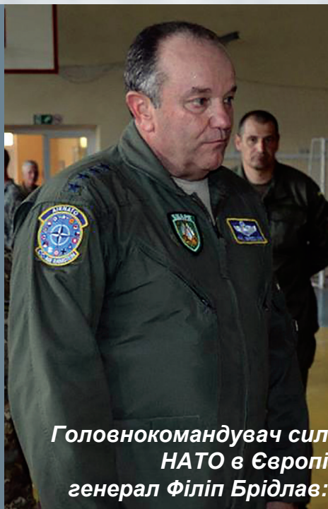
Головнокомандувач сил НАТО в Європі генерал Філіп Брідлав:

Чимало цікавого відбувалося й за лаштунками маневрів. От, до прикладу, питання внутрішньої комунікації, або так зване мовне питання. У 90-х під час «Щита миру»