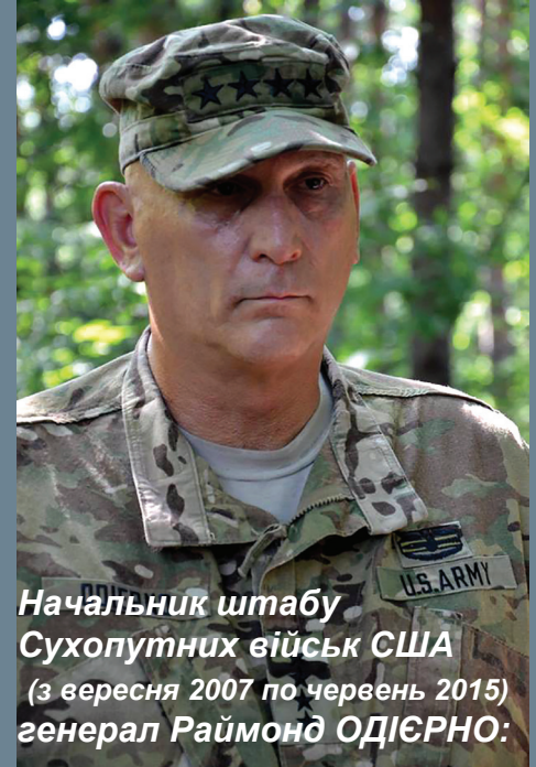
Начальник штабу Сухопутних військ США (з вересня 2007 по червень 2015) генерал Раймонд ОДІЄРНО:

– Тут, на військовому полігоні, створено надзвичайно сприятливі умови для підготовки військовослужбовців Збройних Сил України та проведення заходів міжнародного військового співробітництва. Після мого повернення до Сполучених Штатів Америки доповідатиму, що співпрацю з Україною у галузі сектора безпеки варто продовжувати і посилювати. Вражає завзятість і самовідданість ваших солдатів та офіцерів як під час навчання, так й у реальних бойових діях.