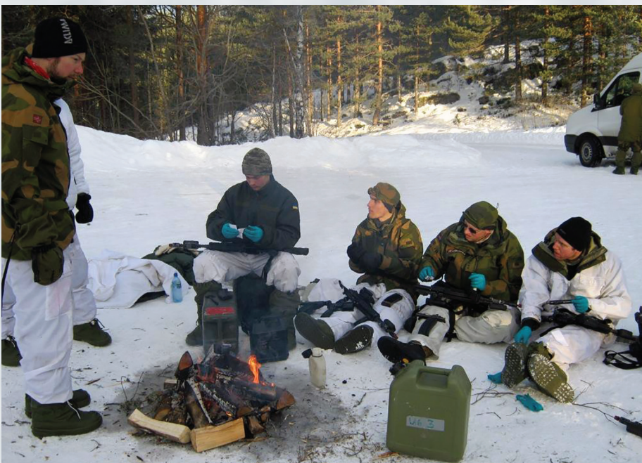
На знімках: під час тренінгів з норвезькими курсантами

Під час складення робочих навчальних програм з тактико-спеціальних і спеціальних дисциплін для командних спеціалізацій обов'язково передбачити практичне відпрацювання навчальних елементів з основ виживання в складних кліматичних умовах. А з метою формування лідерських якостей командирів і самосвідомості кожного військовослужбовця впровадити в життя методичні прийоми роботи інструкторів ЗС Норвегії.