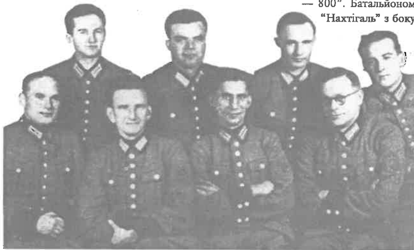
Бійці куреня “Нахтігаль”. Другій зліва сидить Роман Шухевич — майбутній Головний Командир УПА

У червні 1941 р. “Нахтігаль” був укомплектований старшинським складом і налічував 330 солдат, одягнених у польові однострої вермахту. Дальший вишкіл здійснювався разом з першим батальйоном спецполку абверу “Бранденбург — 800”. Батальйоном “Нахтігаль” з боку