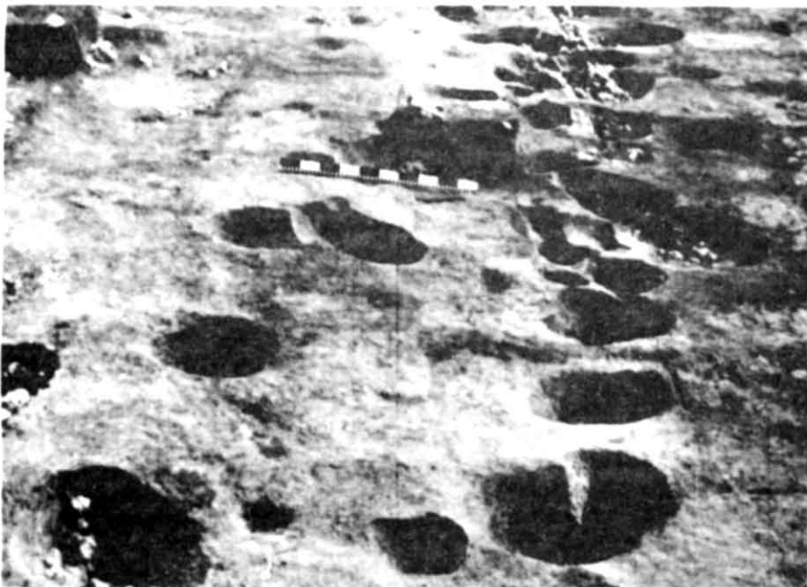
Рис. 2. Західна ділянка ритуального комплексу з огорожею із ямок. Вид з півночі.

Святилище даного періоду являло собою відкриту площадку, без будь-яких архітектурних споруд. Сакральний центр за формою наближався до неправильного широкого незамкненого овалу з нерівними обрисами, поздовжня вісь якого спрямована на північ — північний захід. Простір сакрального центру із заходу, півночі й сходу відділявся від решти території святилища подвійною лінією з розташованих по периметру ямок (рис. 2,3). Їх звичайний діаметр близько 0,2—0,4 м. Ямки доповнювались необробленим камінням, окремі екземпляри якого сягали 0,2—0,5 м у перетині. Розташування каме-