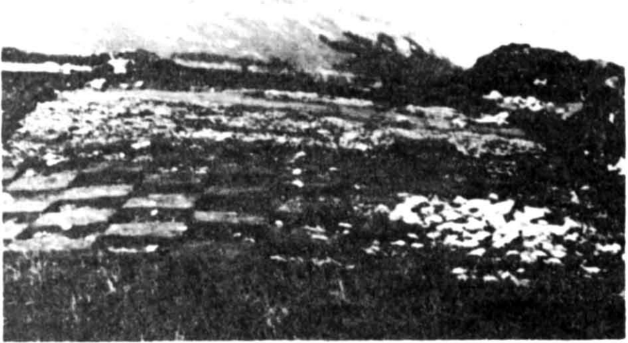
Рис. 1. Розкопки шару світлої глини з неперепаленими кістками з розвалом жертovníка та перекриваючим його зольником на східній ділянці святилища. Вид зі сходу.

з часом розсипалося. Серед каміння дуже багато зубів тварин. Там же знаходились бронзові предмети: кілька деталей окуття ложа, аналогічних знайденим в Артюхівському кургані 4 , ланцюг і платівка у вигляді лунниці. Очевидно, конструкція з необробленого каміння була жертovníком.