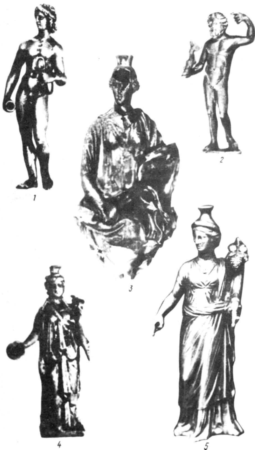
Рис. 4. Срібні статуєтки з розкопок святилища біля перевалу Гурзуфське Сідло. 1 — 3,5 — в натуральну величину; 4 — розміри збільшено вдвічі.