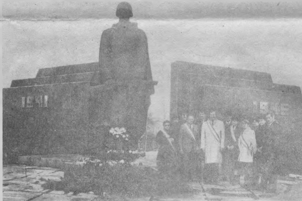
Хвилина мовчання біля пам'ятника броварчанам, загиблим на фронтах Великої Вітчизняної.

А тактовність, притаманної гостям, не завадало б розпочинися і нам. Адже кожен керівника делегації Луї Байре-