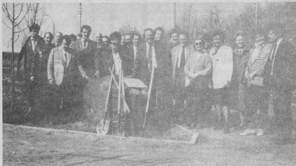
Посаджено перші дерева на Алеї Дружби. А на камені буде прикріплена меморіальна таблиця про цю подію.

та запитали під час прес-конференції про те, що йому не сподобалось в нашому місті, то у відповідь почули слова, гідні справжнього відвертого друга: